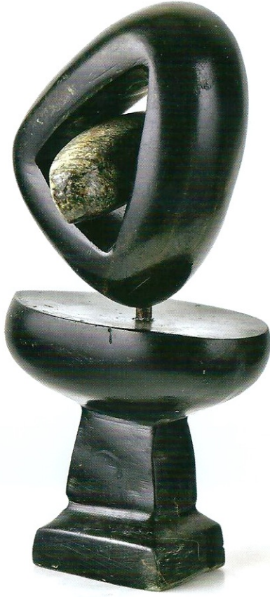
"Dengedeki Form", 2009, 28 x 14 x 9 cm, diorit taşı