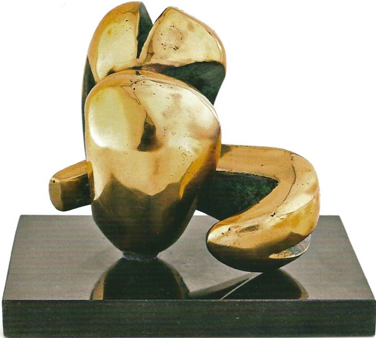
"İç Boşluğumuzdan Bakmak", 2010, 16 x 15 x 13 cm, bronz