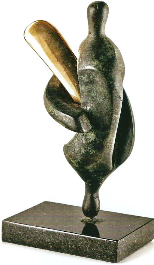
"Sevgiyi Tutan İdol", 2010, 21 x 11 x 11 cm, bronz