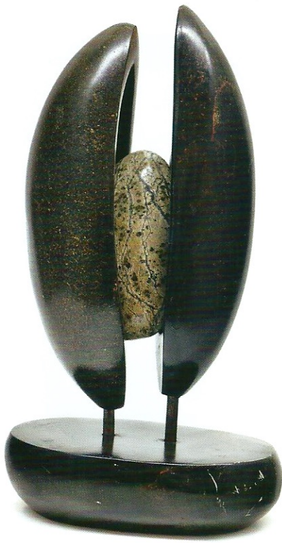
"Taşlardaki Sevgi", 2009, 34 x 19 x 12 cm, diorit taşı