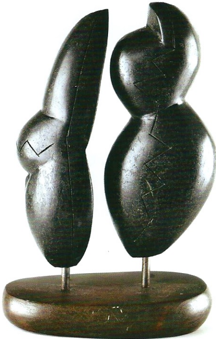
"Anadolu İdollerleri", 2009, 30 x 19 x 10 cm, diorit taşı