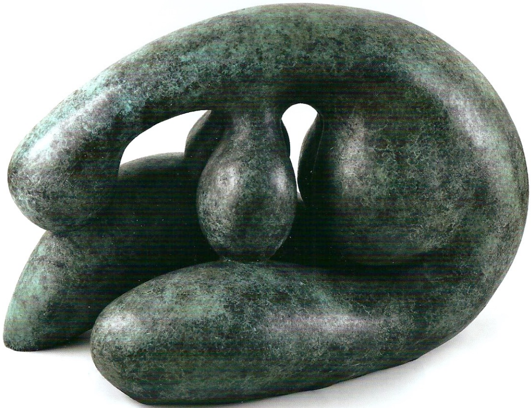
"Düşünen Ana", 1980, 42 x 64 x 36 cm, bronz