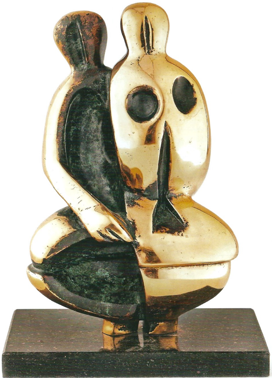
"İkili İdol", 2010, 21 x 18 x 15 cm, bronz