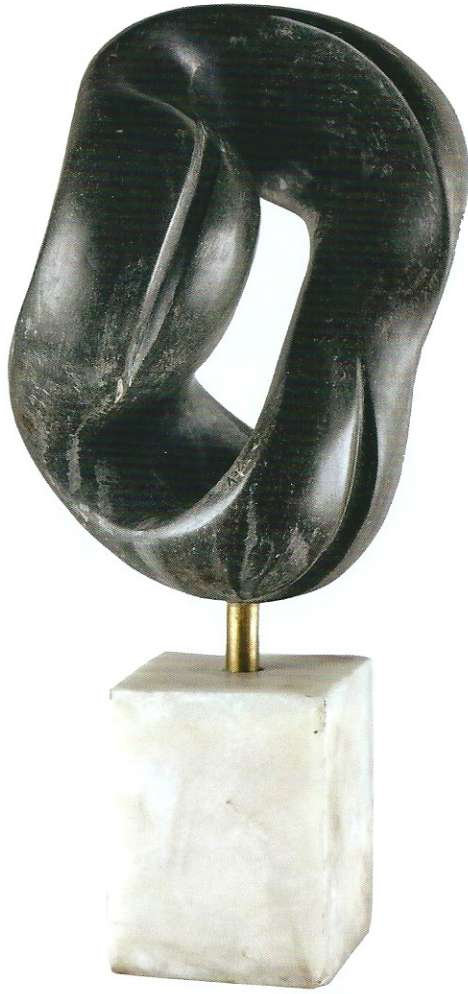
"İçe Dönmek", 2007, 40 x 18 x 20 cm, diorit taşı