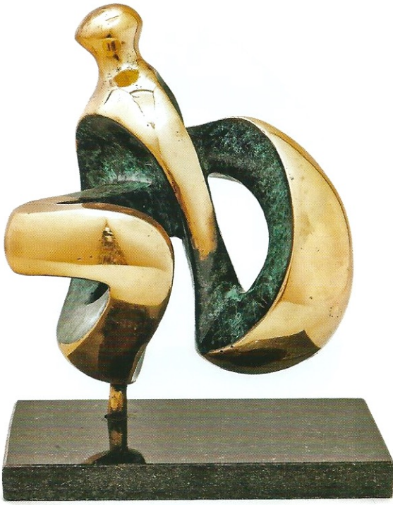
"İdolün Farklılaşması", 2010, 22 x 19 x 15 cm, bronz