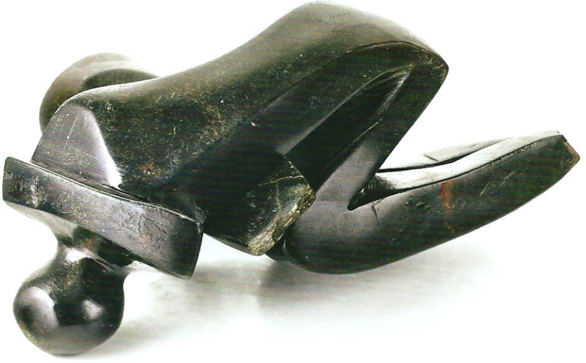
"Yüzüstü sarılmak", 2009, 15 x 27 x 30 cm, diorit taşı