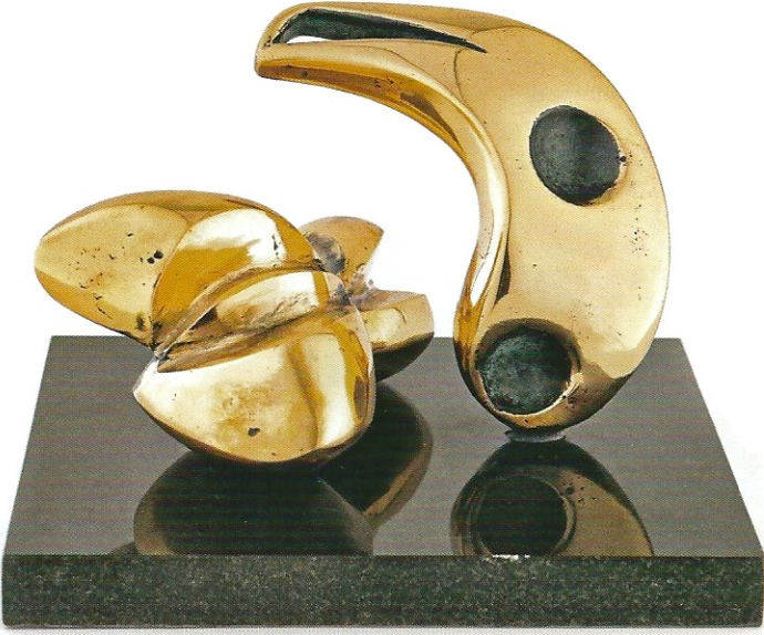
"İki Farklı Duruş", 2010, 12 x 18 x 19 cm, bronz