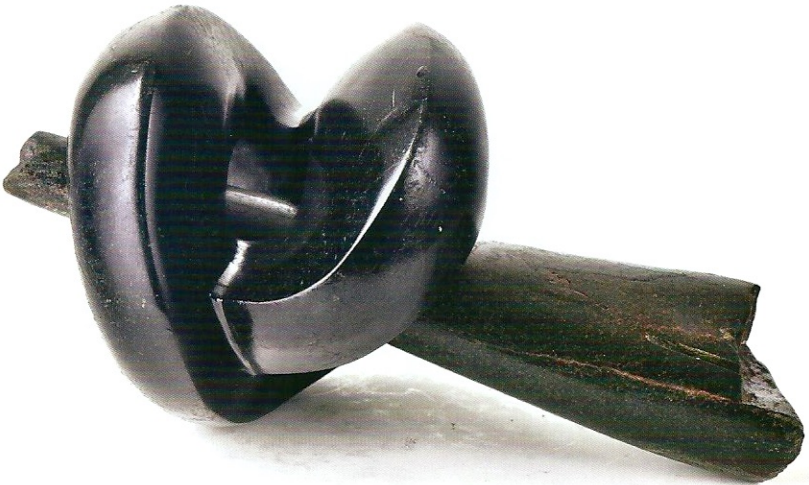
"Dengelerin Değişimi", 2009, 15 x 27 x 18 cm, diorit taşı