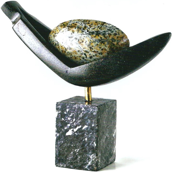
"Dünyayı Taşımak", 2007, 29 x 33 x 8,5 cm, diorit taşı