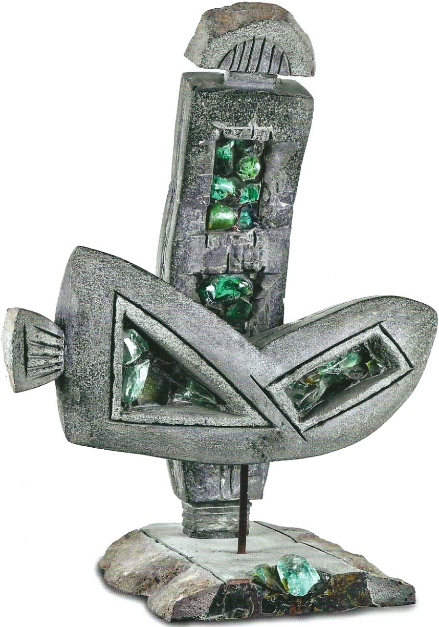
"İdolün Penceresi", 1998, 80 x 62 x 64 cm, bazalt

Ön kapak: "Taştaki Uygarlık", 1998, 89 x 67 x 33 cm, bazalt