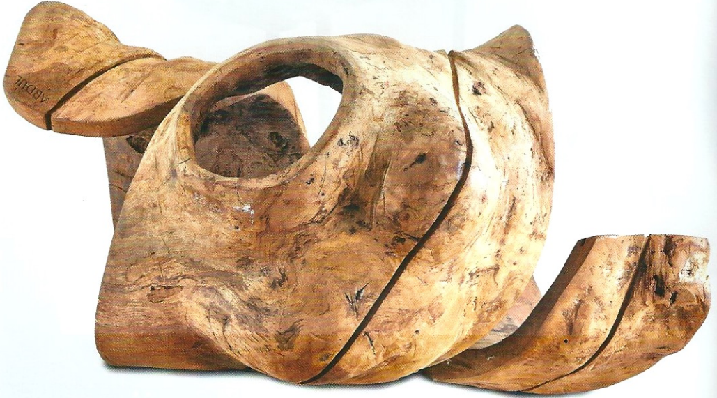
"Zamanın Oluşumu", 1995, 76 x 107 x 60 cm, meşe