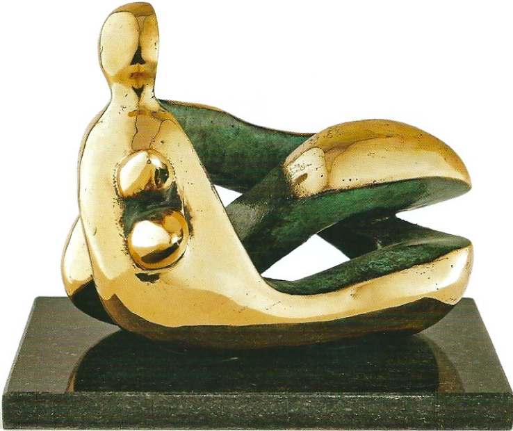
"Boşluğu Sarmak", 2010, 18 x 23 x 15 cm, bronz