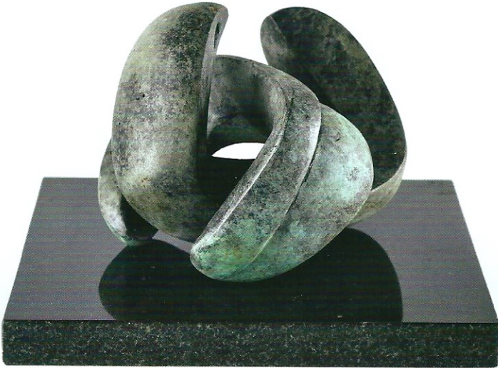
"İç İçe Geçenler", 2010, 13 x 15 x 15 cm, bronz