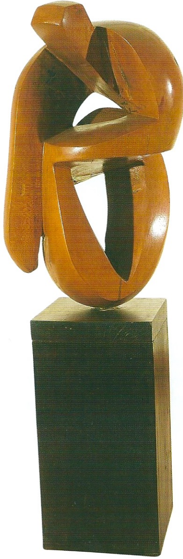
"Soyutlaşan Figür", 2008, 130 x 42 x 35 cm, ağaç

Ön Kapak: "Ana Figür", 2008, 178 x 42 x 15 cm, ağaç