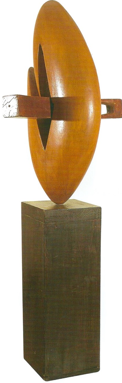
"Vücut Hareketi", 2008, 150 x 58 x 40 cm, ağaç