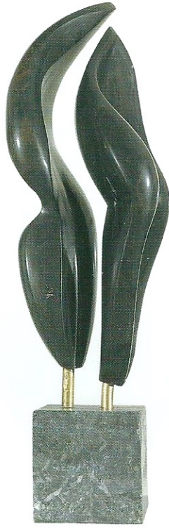
"Taşların Sevgisi Bitmez", 2007, 54 x 15 x 15 cm, diorit taşı