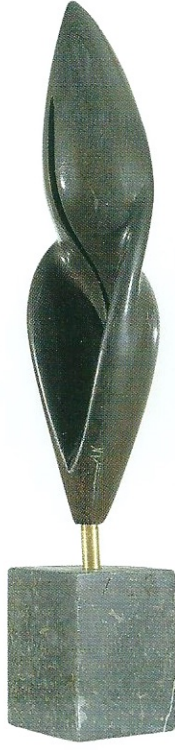
"Sonsuzluğa Uzanmak", 2007, 57 x 11 x 11 cm, diorit taşı