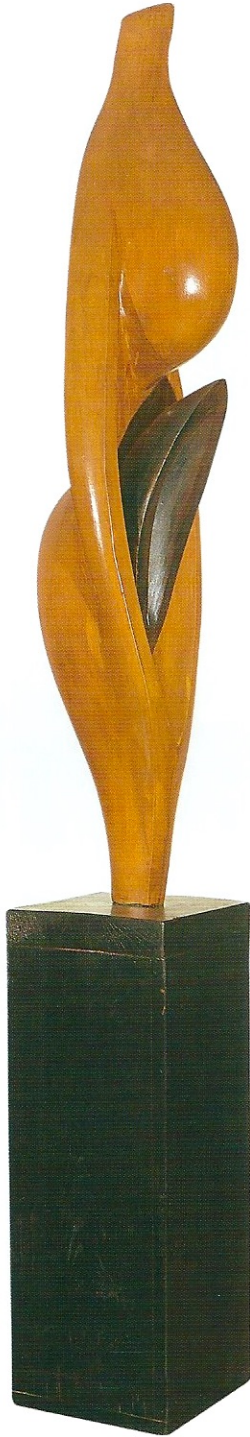
"İdolleşen Form", 2008, 192 x 32 x 29 cm, ağaç