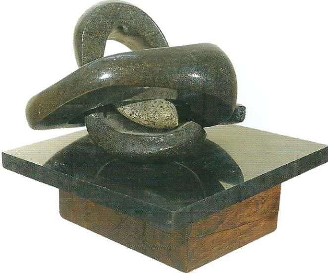
"İç Boşluğumuz", 2007, 18 x 26 x 24 cm, diorit taşı