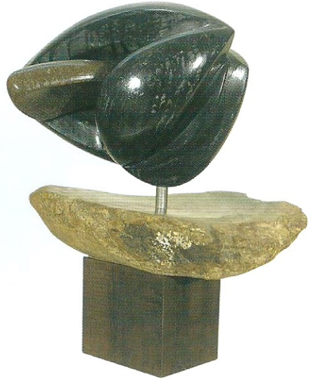
"Taşınan Sevgi", 2007, 34 x 26 x 19 cm, diorit taşı