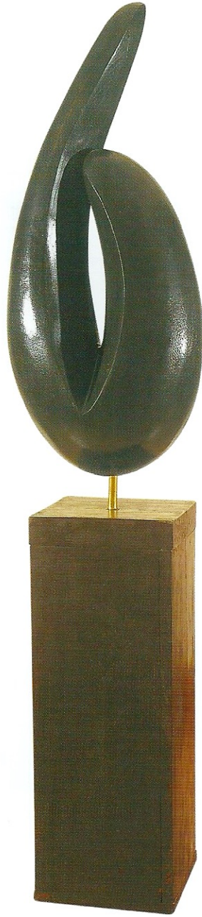
"Değişimdeki Soyutluk", 2008, 156 x 32 x 40 cm, ağaç