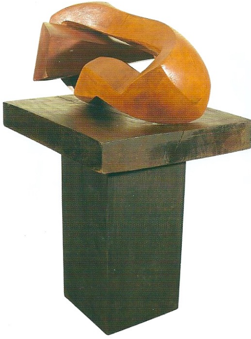
"Figürde Değişim", 2008, 104 x 45 x 69 cm, ağaç