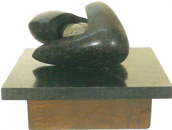
"İçte Olmak", 2007, 26 x 25 x 16 cm, diorit taşı