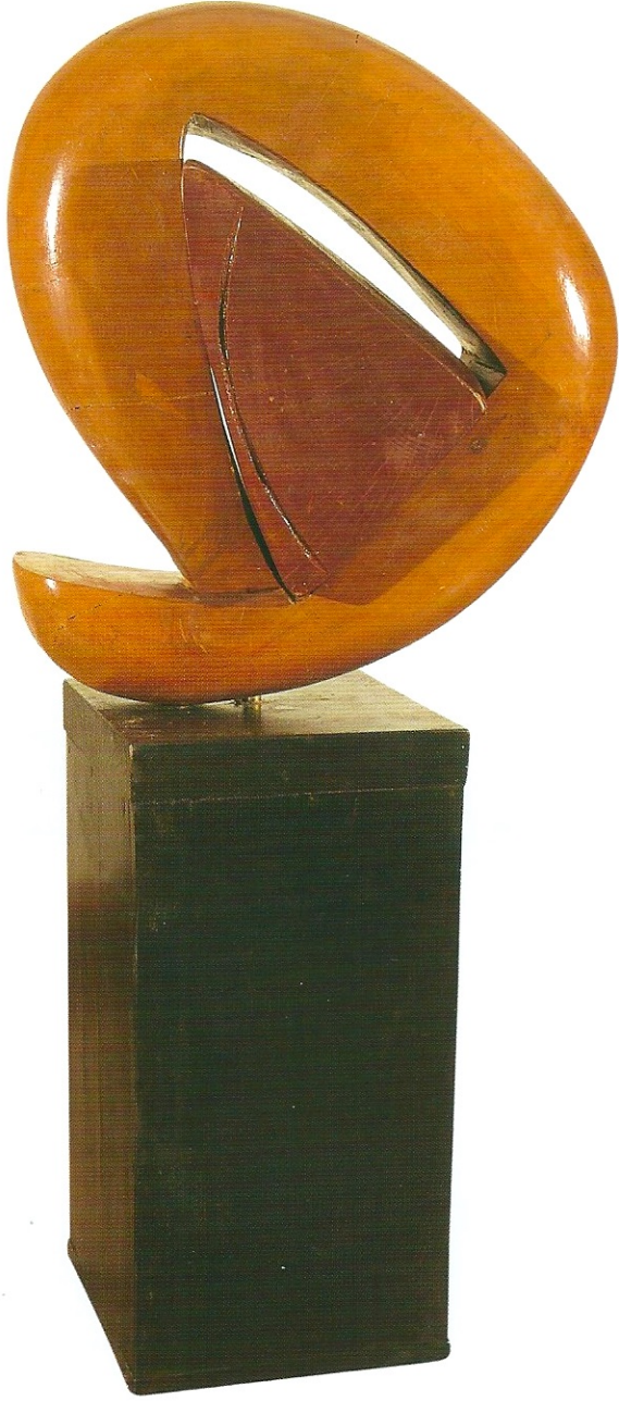
"Kendi Boşluğunu Saran", 2008, 120 x 60 x 69 cm, ağaç