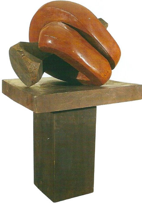
"Sonsuzluğa Geçiş", 2008, 121 x 55 x 32 cm, ağaç