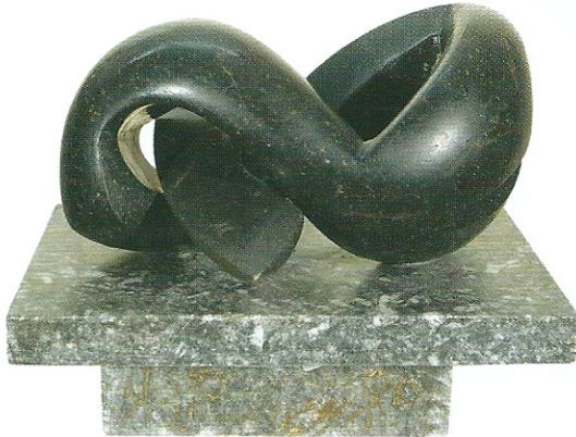
"Uzanan Figür", 2006, 24 x 30 x 24 cm, diorit taşı