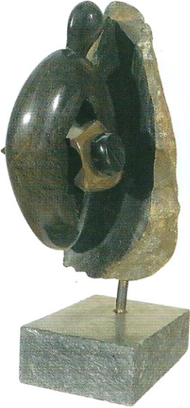
"İçten Sarılan Figür", 2007, 50 x 26 x 30 cm, diorit taşı