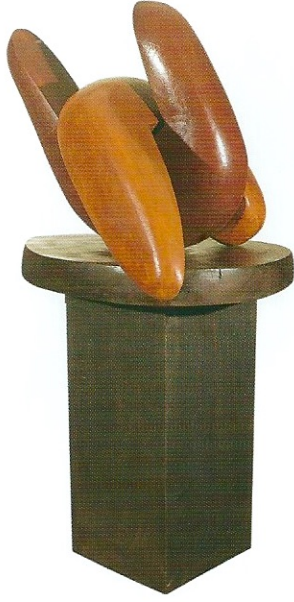
"Formların Bütünleşmesi", 2008, 116 x 64 x 45 cm, ağaç