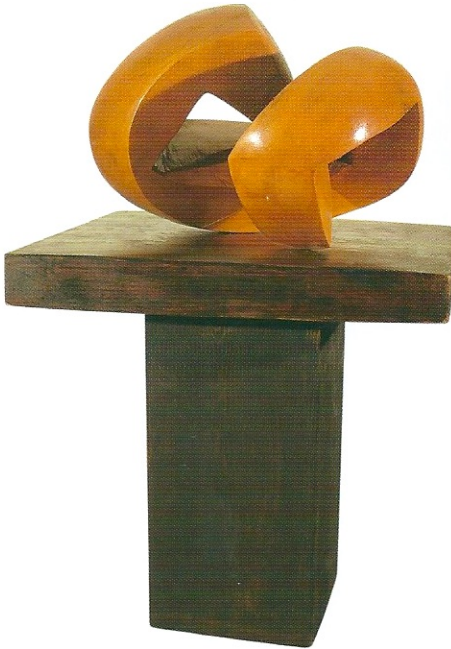
"Görsellik Farklılaşır", 2008, 110 x 35 x 44 cm, ağaç