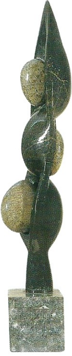
"Sonsuzluğa Uzanan", 2007, 68 x 14 x 13 cm, diorit taşı