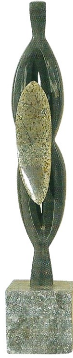
"Sevgiyi Taşımak", 2007, 55 x 15 x 9 cm, diorit taşı