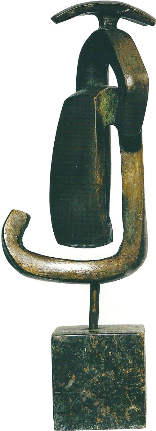
"Taşadığımız Mutluluklar", 2002, 15 x 23 x 17 cm, bronz