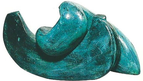
"Birlikte Yaşam", 2003, a) 14 x 24 x 5.5 cm, b) 11 x 23 x 10 cm, bronz