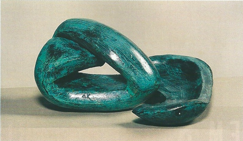
"Negatif ve Pozitif", 2003, a) 12 x 18 x 14 cm, b) 4.5 x 25 x 10 cm, bronz

Öztürk'ün sergisindeki heykelleri, imgelerin formlaşması ve biçimlerin soyutlayışa uğrayarak değişimlerinin uzun araştırmaları sonucudur. Plastik formlarda heykelsel değerlerin çözümü deneysel araştırmalarla heykeli meydana getirir. Sanatçı, plastik değerlere öncelik verirken heykelin estetik, devingen ve yenilikçi olmasına dikkat eder. Her heykel formu bir diğerinden farklı olduğu gibi aynı zamanda öbürünün öncüsüdür; bir bütünü tamamlayıcıdır. Sanki satranç taşları gibi sergide birbiri ile ilişkilidir; aynı değerleri taşıyarak bir bütünü oluştururlar.