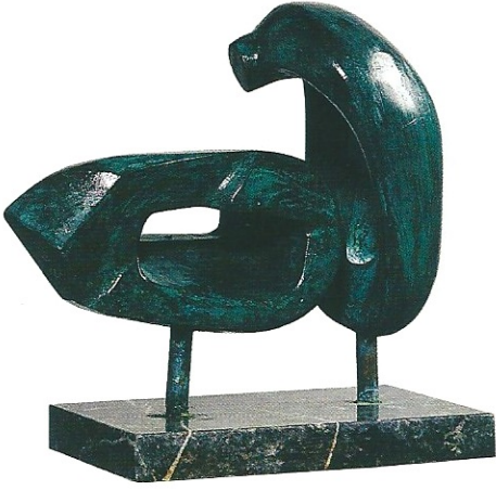
"İkili Birliktelik", 2003, 27 x 28 x 10 cm, bronz