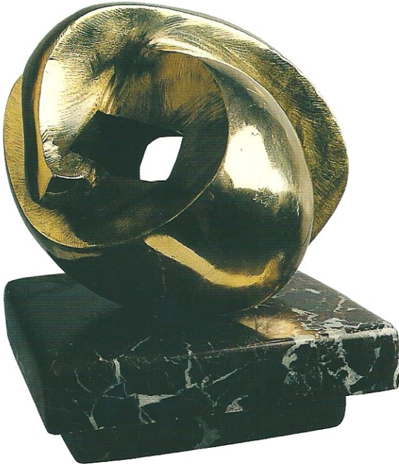
"Duyguya Dönüşen Yaşam", 2000, 16 x 22 x 19 cm, bronz