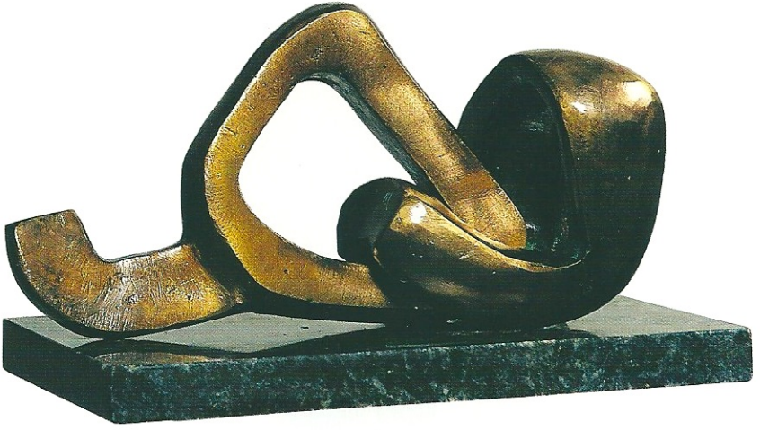
"Geçmeli Figür", 2003, 23 x 25 x 14 cm, bronz