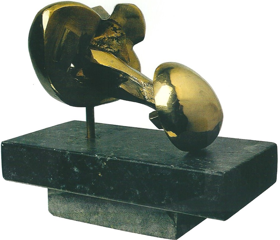
"Figürlerin Sevdası", 2001, 14 x 19 x 17 cm, bronz