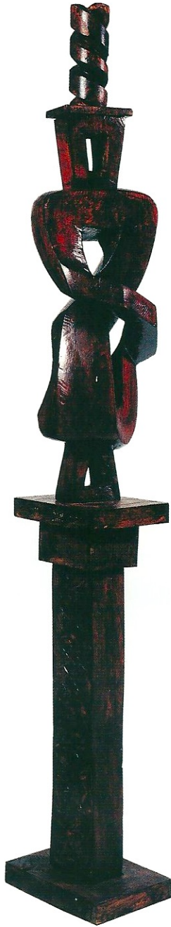
"Ufuktaki Dans", 2003, 160 x 22 x 23 cm, ceviz