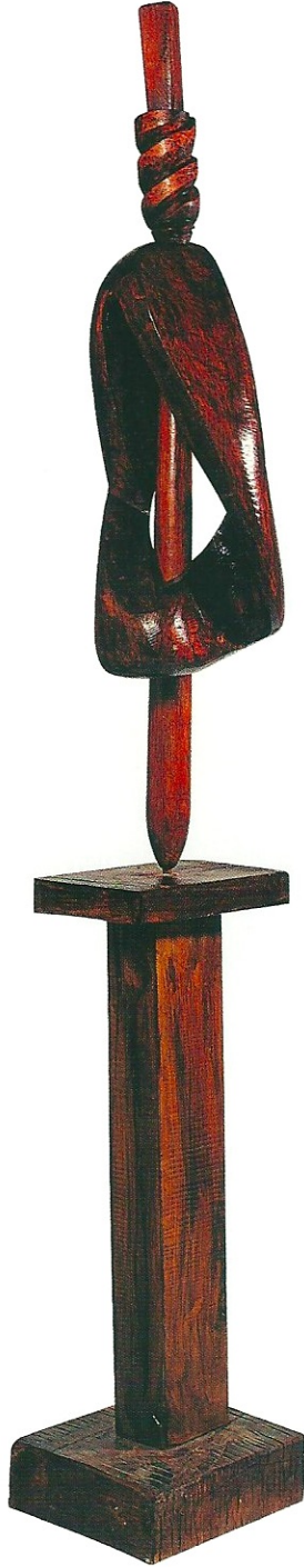
"Bulutlar İinde Olmak", 2003, 167 x 23 x 27 cm, ceviz