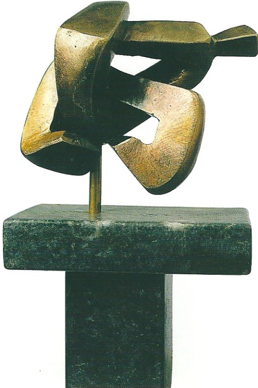
"Taşdığımız Mutluluklar", 2002, 19 x 23 x 17 cm, bronz