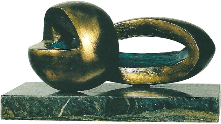
"Figürün Görseiliđi", 2003, 24 x 27 x 16 cm, bronz