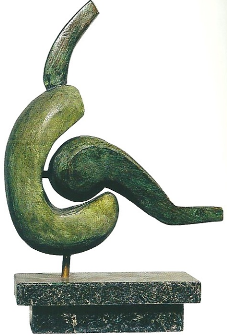
"İç İçte Yaşam", 2002, 37 x 28 x 12 cm, taş - bronz