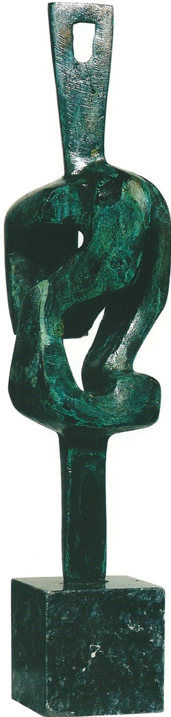
"Mutlu Olmak", 2003, 45 x 11 x 11 cm, bronz