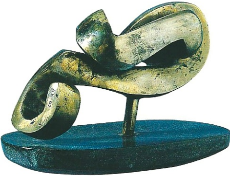
"İçteki Dünya", 2002, 32 x 27 x 16 cm, bronz