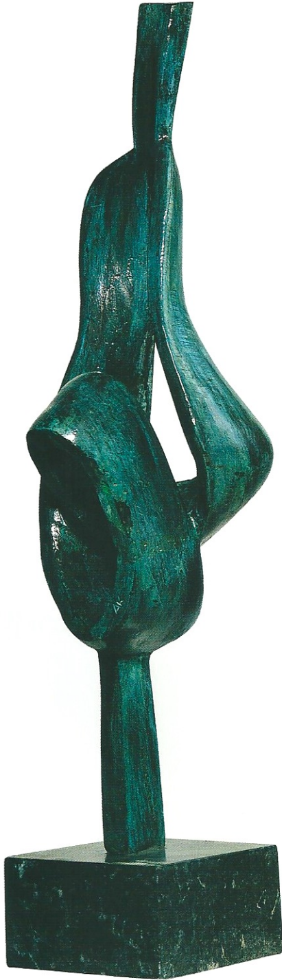
"İçten Dönüşüm", 2003, 58 x 17 x 14 cm, bronz