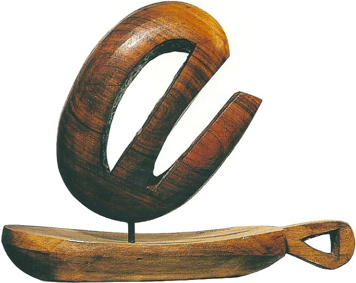
"Farklı Olmak", 2002, 48 x 51 x 19 cm, ceviz ağacı