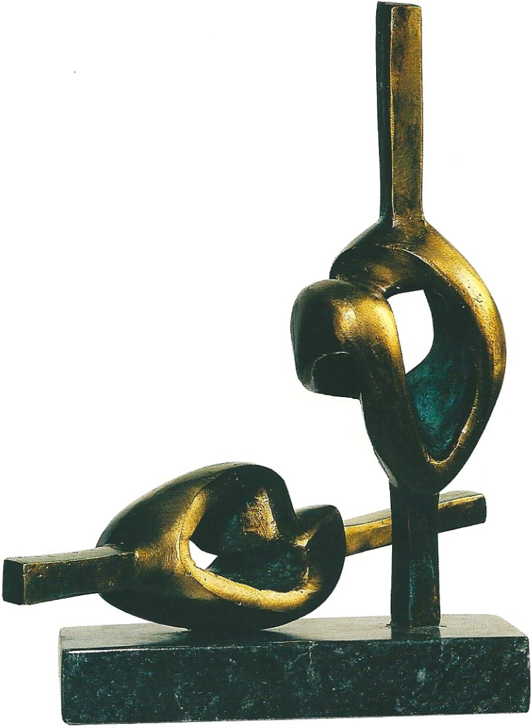
"Ayakta ve Yatan Figür", 2003, 44 x 30 x 10 cm, bronz

Ön Kapak: "Düşüncesini Taşıyan", 2003, 41 x 20 x 12 cm, bronz