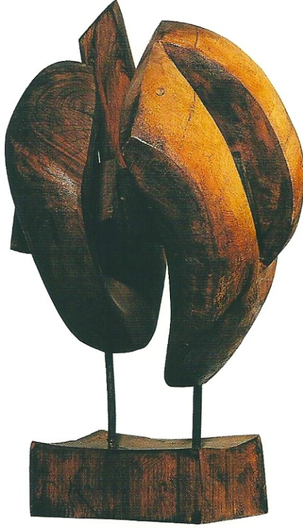
"İkili Özgürlük", 2002, 63 x 36 x 40 cm, ceviz ağacı