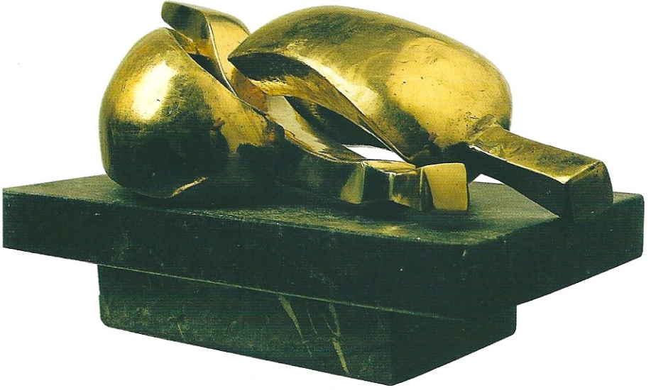
"İç İçe Olan Figürler", 2001, 9 x 32 x 17 cm, bronz