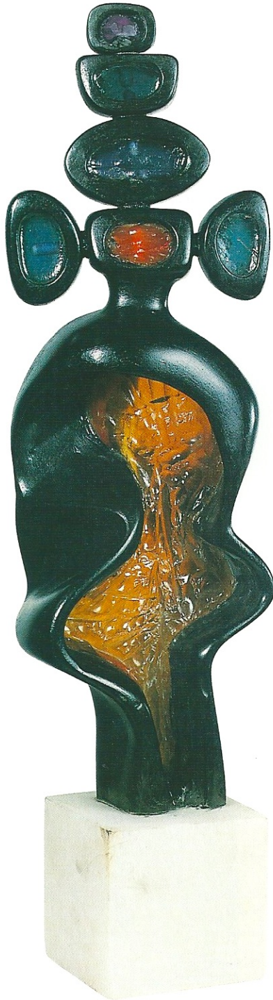
"Küveli Kraliçe", 2001, 57 x 15 x 9 cm, serpantin / pleksiglas