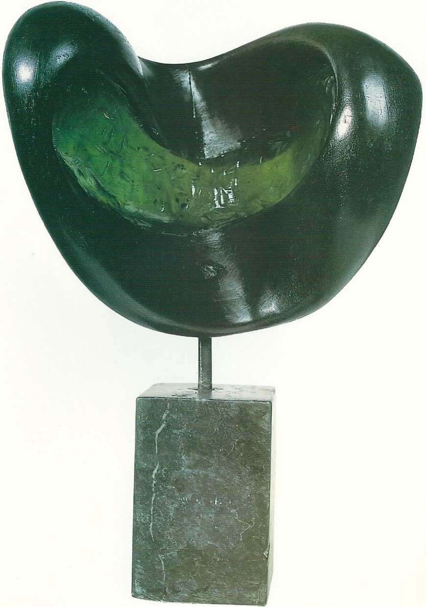
"Eğilimli Olmak", 2001, 35 x 22 x 17 cm, serpantin / pleksiglas