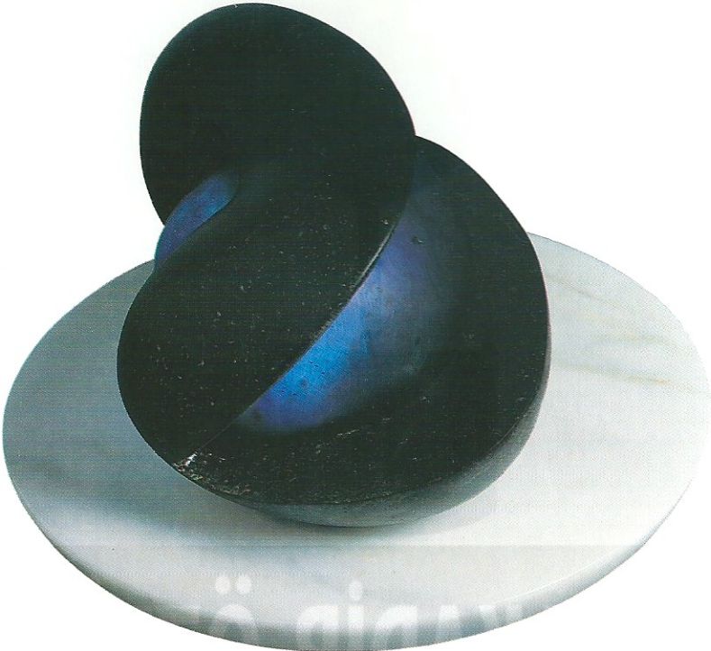
"Başkalaşan Dünya", 2001, 22 x 34 x 25 cm, serpantin / ışıklı pleksiglas