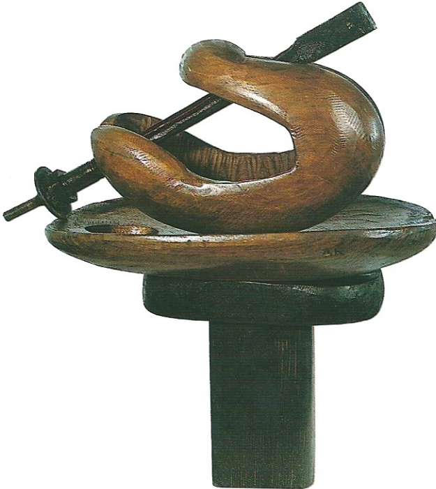
"Dünyanın Sırrı", 2000, 40 x 35 x 24 cm, ceviz ağacı / metal