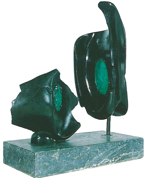
"İkili İdol", 2000, 38 x 30 x 14 cm, serpantin / pleksiglas