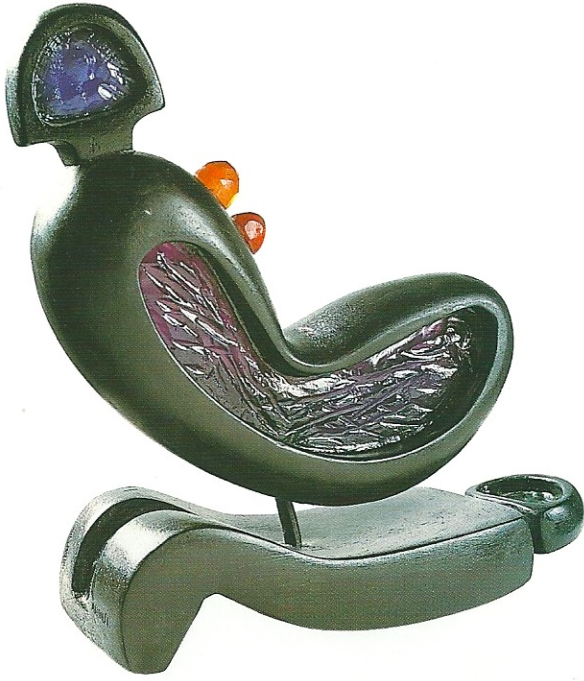
"Hayal Üstünde Yaşam", 2001, 30 x 31 x 11 cm, serpantin / pleksiglas