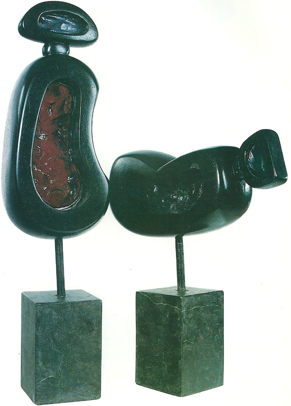
"Mor ve Kırmızı İdoller", 2001, 28 x 26 x 8 cm, 49 x 11 x 8.5 cm, serpantin / pleksiglas