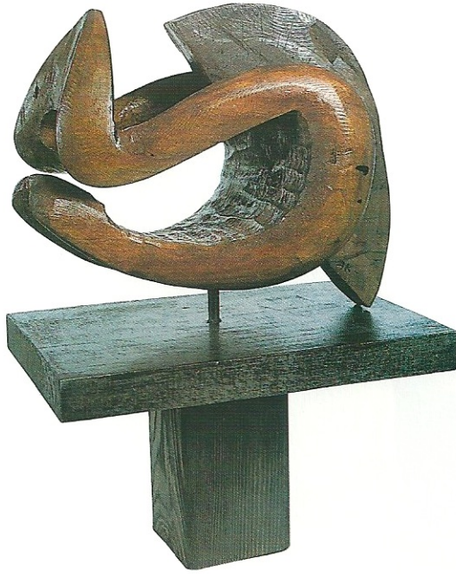
"Karşılıklı Sevgi", 2000, 44 x 30 x 14 cm, ceviz ağacı