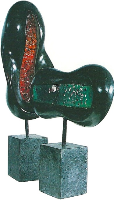
"Kırmızı ve Yeşil İdoller", 2000, 31 x 32 x 9 cm, 54 x 16 x 9 cm, serpantin / pleksiglas