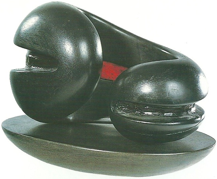
"Yatan Figürün Çıplaklığı", 2001, 21 x 30 x 18 cm, serpantin / pleksiglas