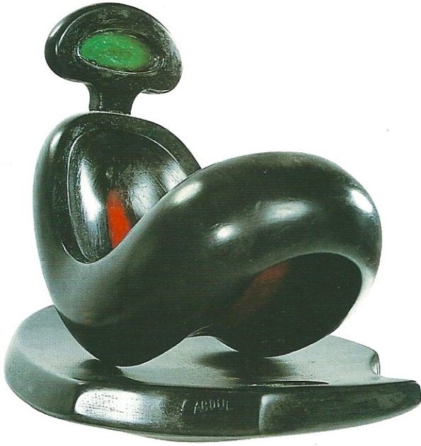
"Üstteki Sevgi", 2001, 29 x 24 x 35 cm, serpantin / pleksiglas