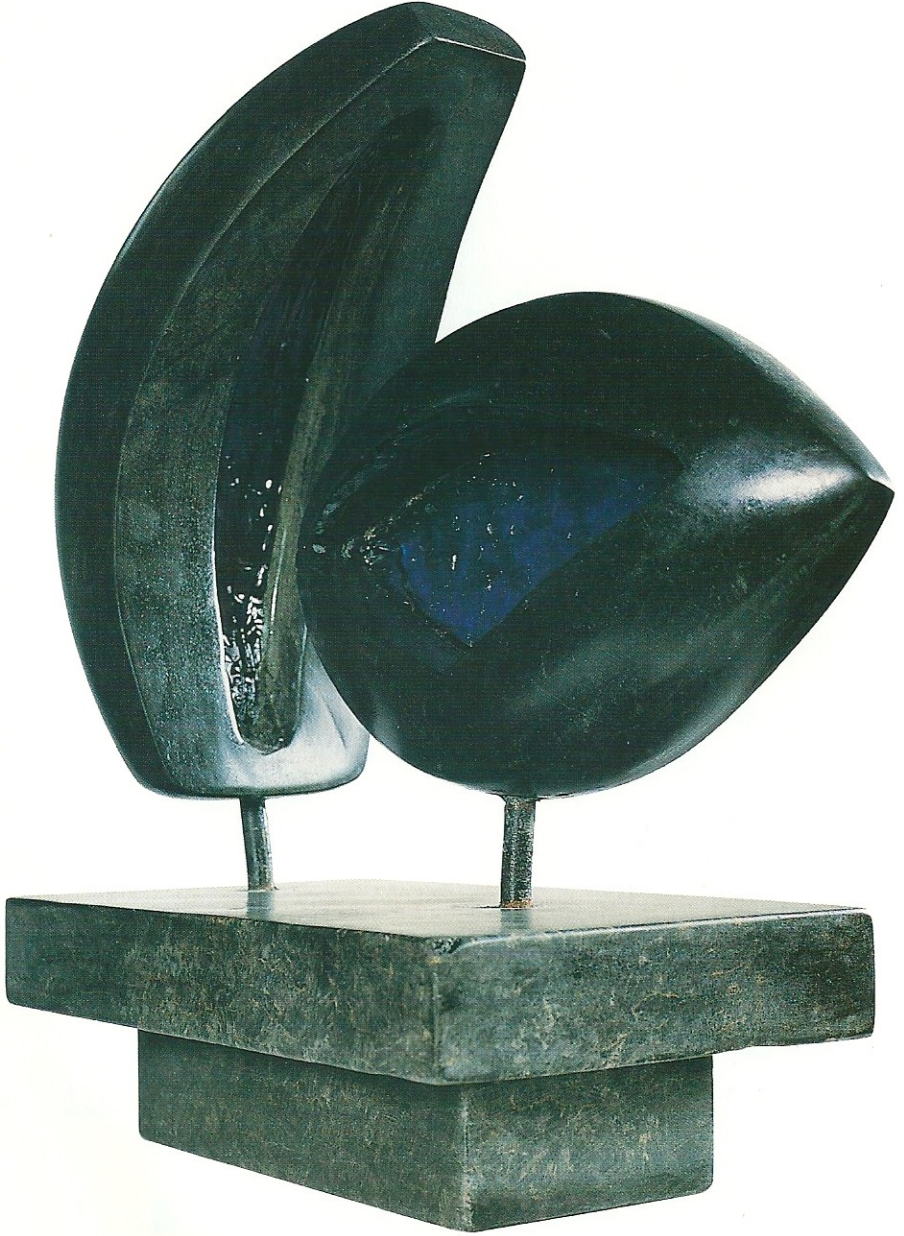
"Özgürlüğü Yaşamak", 2001, 41 x 38 x 17 cm, serpantin / pleksiglas