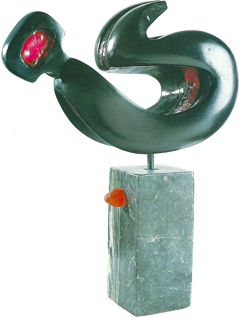
"Sıcak Özlem", 2001, 38 x 30 x 10 cm, serpantin / pleksiglas

Ön Kapak: "Mavi Dünyam", 2001, 64 x 18 x 18 cm, serpantin / pleksiglas Arka Kapak: "Düşler Üstünde", 2001, 39 x 26 x 17 cm, serpantin / pleksiglas