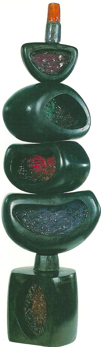
"Kathi ídol", 2001, 65 x 17 x 15 cm, serpantin / pleksiglas