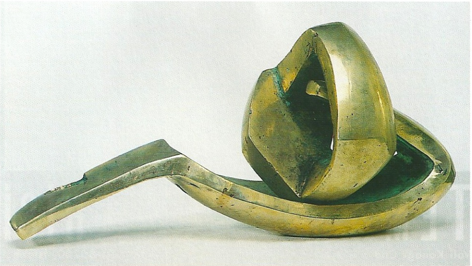
"Sevginin Oluşumu", 2000, 16 x 14 x 34 cm, bronz

Öztürk ışığı da taşla aynı değerlerde yontarak ona şekil ve biçim vermiş, sonsuz form bütünlüğüne ulaşmasını sağlamıştır. Sonsuzluk, heykellerde soyutlayıcı gizlerle anlatılmıştır.