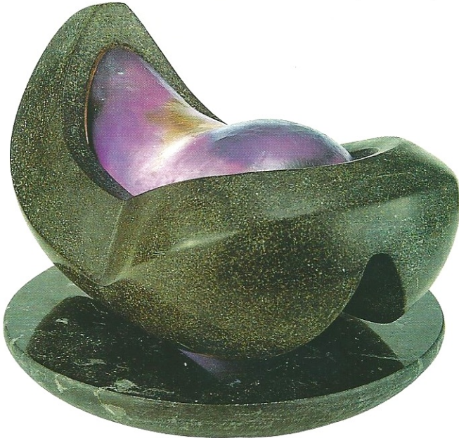
"Ateşli Dünya", 2001, 45 x 26 x 20 cm, serpantin / pleksiglas