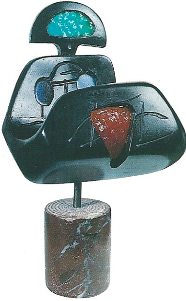
"Renkli İdol", 2000, 44 x 21 x 14 cm, serpantin / pleksiglas