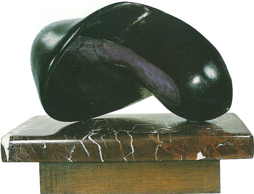
"Yatan Figür", 2000, 24 x 31 x 17 cm, serpantin / pleksiglas