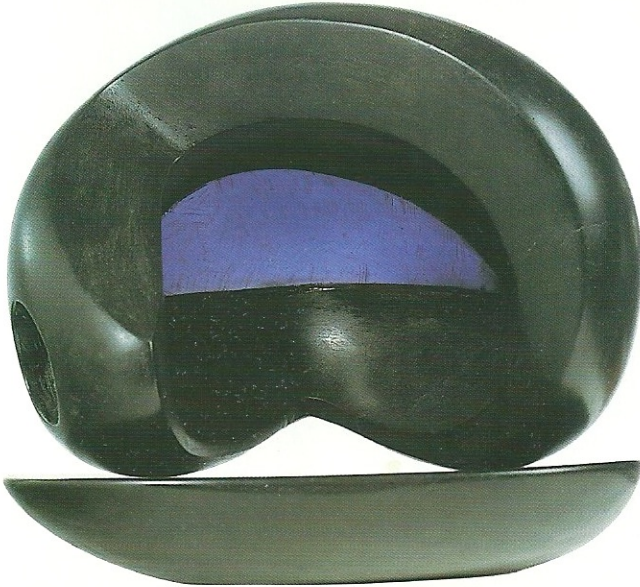
"Mavi İçindeki Yaşam", 2001, 26 x 30 x 22 cm, serpantin / pleksiglas