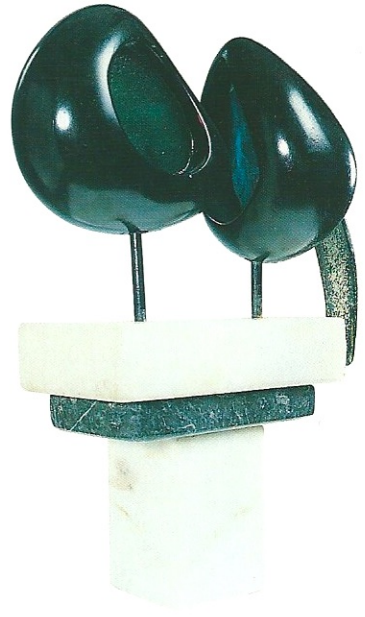
"Renkli İkili", 2000, 42 x 28 x 12 cm, serpantin / pleksiglas