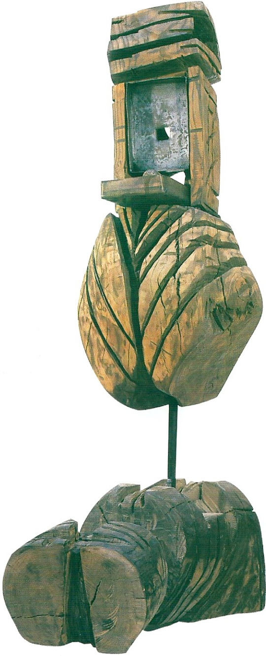
"Sevginin Doğuşu", 1998, 146 x 89 x 44 cm, ağaç