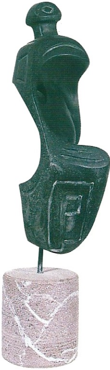
"Taş Dađın Öyküsü", 1996, 55 x 18 x 21 cm, taş