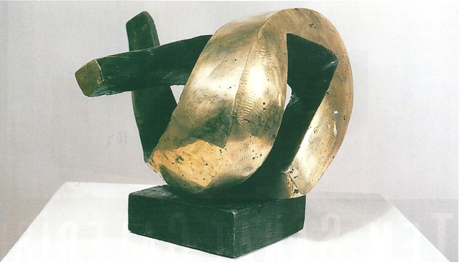
"Değişim", 1999, 16 x 20 x 19 cm, bronz

Abdulkadir Öztürk'ün biçim ve biçimlendirme dili, geçmiş kültürlerin izlerini soyutlayıcı gizemlerle anlatır. Konusunu insandan alan Abdulkadir Öztürk'ün, heykelleri genellikle çok çeşitli malzemelerden yontulmuştur. Granit, bazalt, diorit ve serpantin taş çeşitleri yanında, bronz, ağaç ve metallerle yaptığı heykeller, yaşadığı bölgenin büyüklü anlamlarla dolu idollerini simgeler.