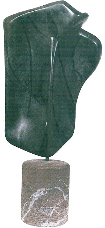
"Çoban II", 1997, 46 x 23 x 14 cm, taş