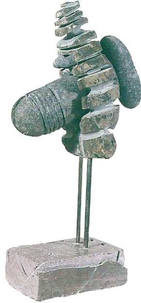
"Ana Tanrıça", 1998, 48 x 24 x 17 cm, serpantin