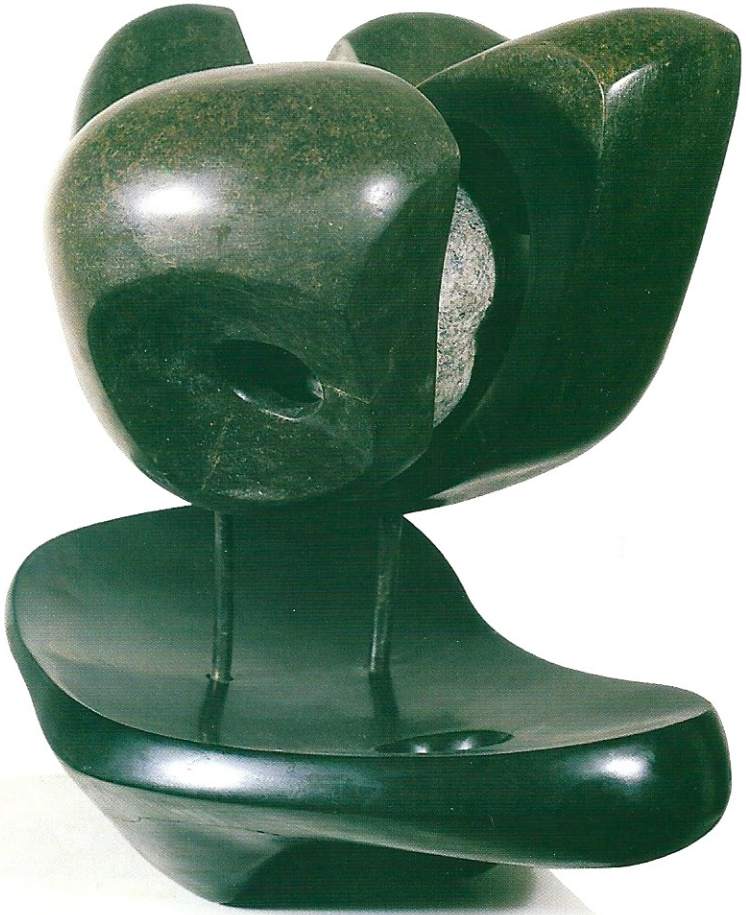
"Taşların Oluşumu", 1999, 42 x 50 x 27 cm, serpantin, diorit

Ön Kapak: "Ana Kraliçe", 1998, 170 x 45 x 25 cm, bazalt Arka Kapak: "Ritm", 1997, 63 x 32 x 26 cm, serpantin