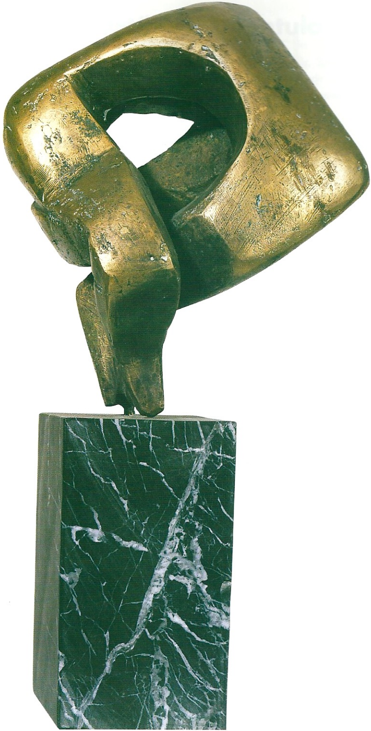
"Sarmaşık Sevgi", 1996, 18 x 16 x 13 cm, bronz