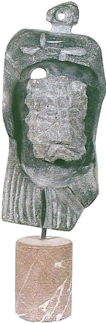
"Düşlerin Doğuşu", 1999, 56 x 18 x 15 cm, bazalt, serpantin