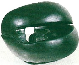
"Çatlattan Oluşum", 1999, 20 x 28 x 25 cm, diorit, serpantin