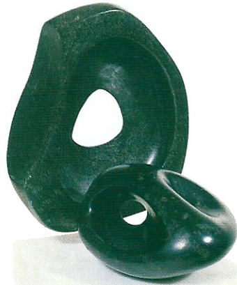
"Sen Böyle Yaşa", 1999, serpantin volkanik a) 24 x 21 x 9 cm, b) 10 x 15 x 12 cm