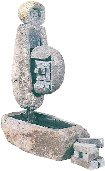
"Değirmenin Suyu", 1999, 42 x 30 x 15 cm, bazalt