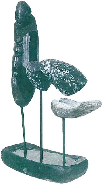
"Üçlü Kompozisyon", 1999, 42 x 25 x 12 cm, mermer, diorit, serpantin