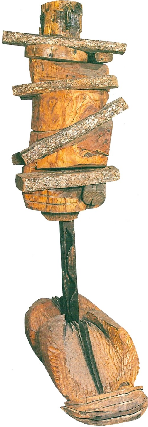
"İdollerin Yaşamı", 1998, 163 x 90 x 45 cm, ağaç