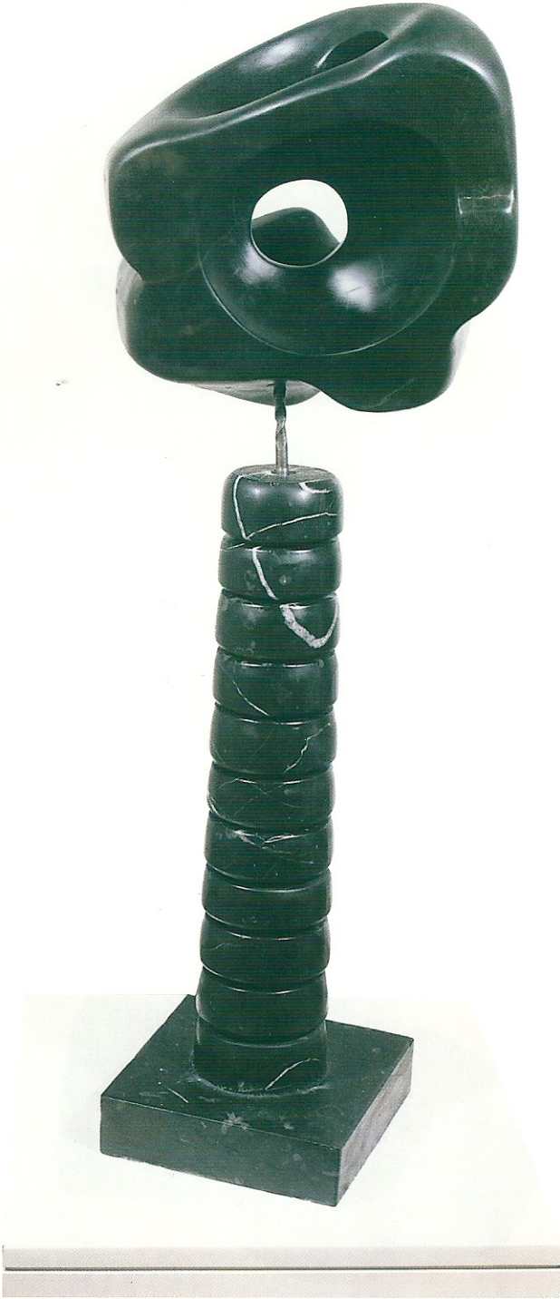
"Boşluktaki Özgürlük", 1999, 86 x 40 x 32 cm, serpantin, mermer