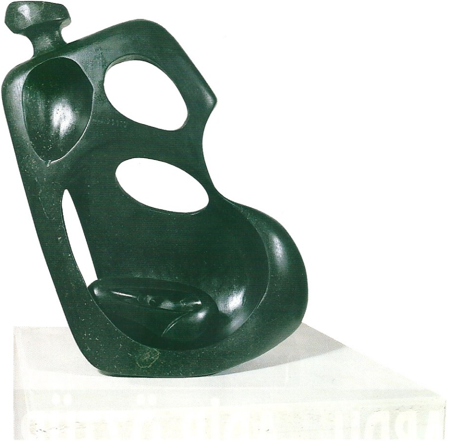
"İçimizdeki Sevgi", 1999, 30 x 28 x 11 cm, serpantin