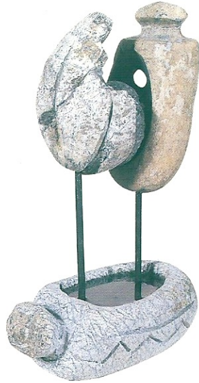
"İçteki Oluşum", 1999, 35 x 20 x 11 cm, diorit, serpantin