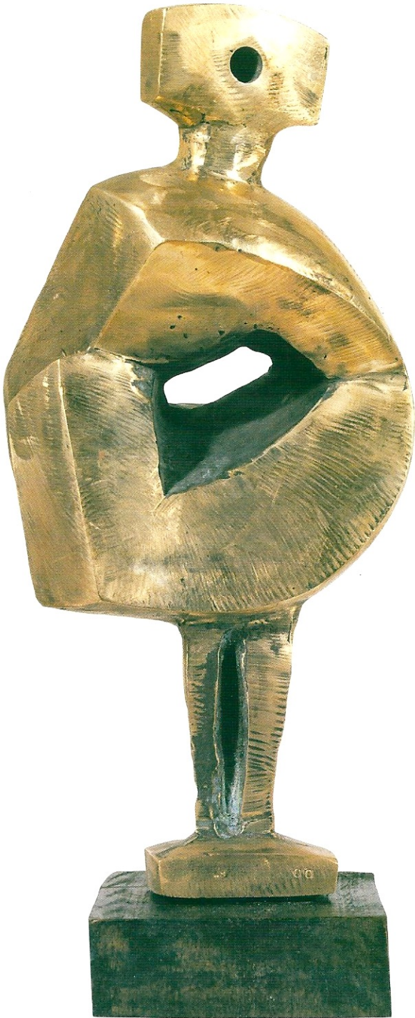
"Görünüm", 1999, 31 x 15 x 19 cm, bronz