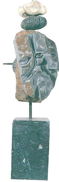
"Yüzdeki İfade", 1997, 49 x 15 x 17 cm, serpantin, kemik, ağaç