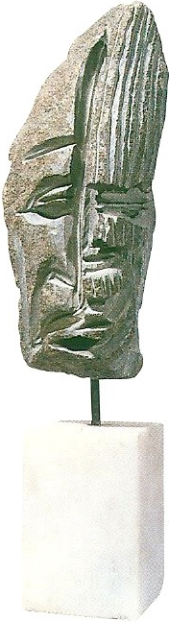
"Taştaki Yüzler", 1998, 51 x 14 x 14 cm, serpantin