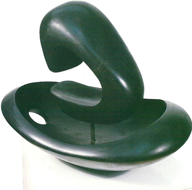
"İç İçe Yaşam", 1999, 44 x 56 x 41 cm, serpantin