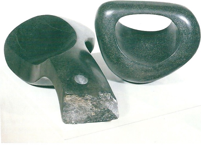
"Dođal Őeklimiz", 1999, a) 21 x 25 x 17 cm, Serpantin b) 14 x 50 x 28 cm, serpantin