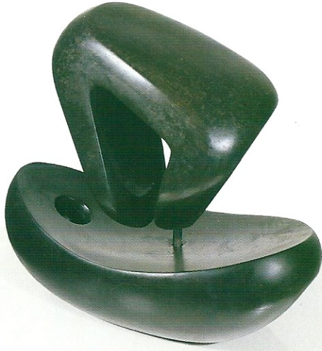
"İç İçe Bakış", 1999, 31 x 35 x 18 cm, serpantin