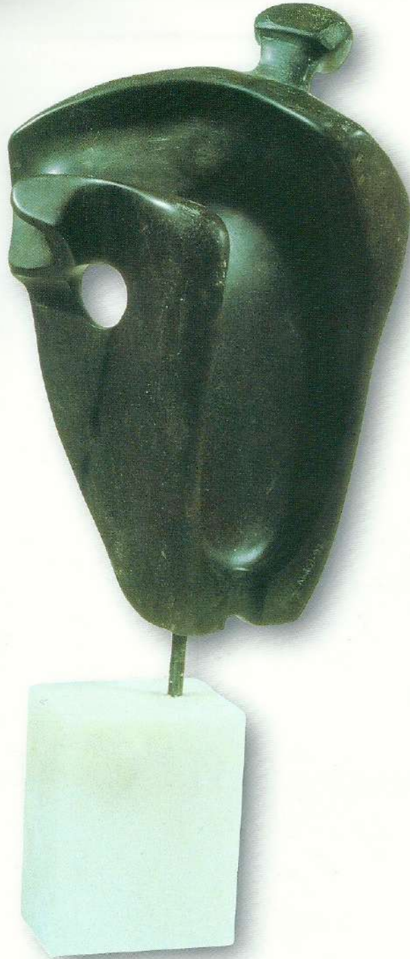
"Zaman İinde Farklı Grnmek" - 1996, Taş, 53x22x12 cm.