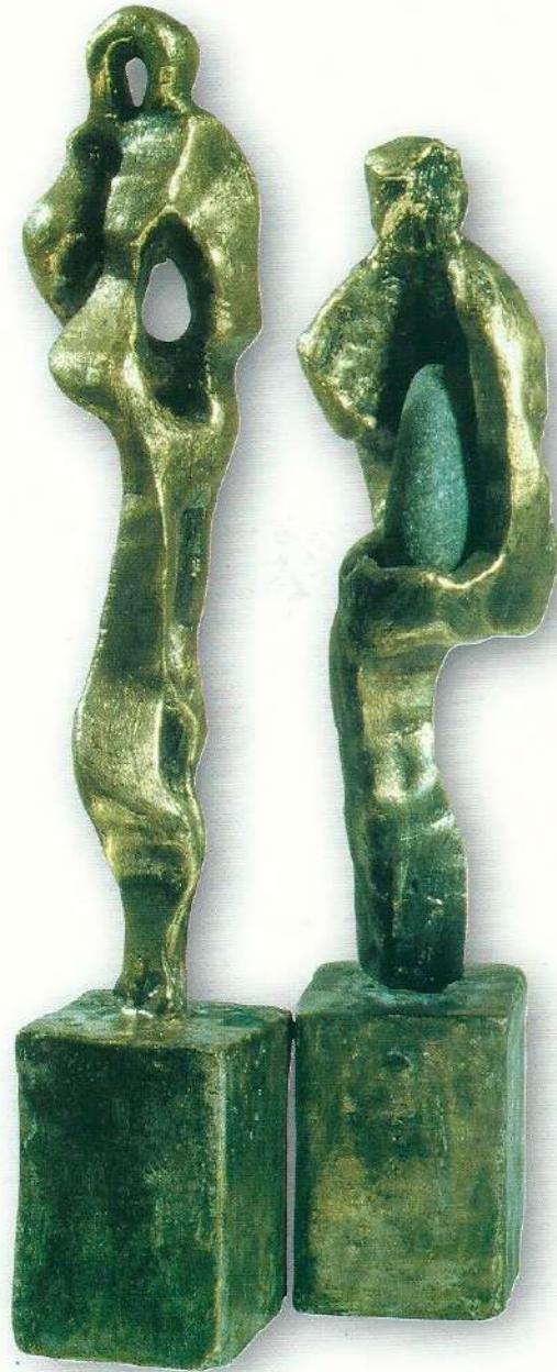
"Kat Kat Uzanmak" - 1997, B ronz, a) 29x5x5 cm. b) 25x6x6 cm.