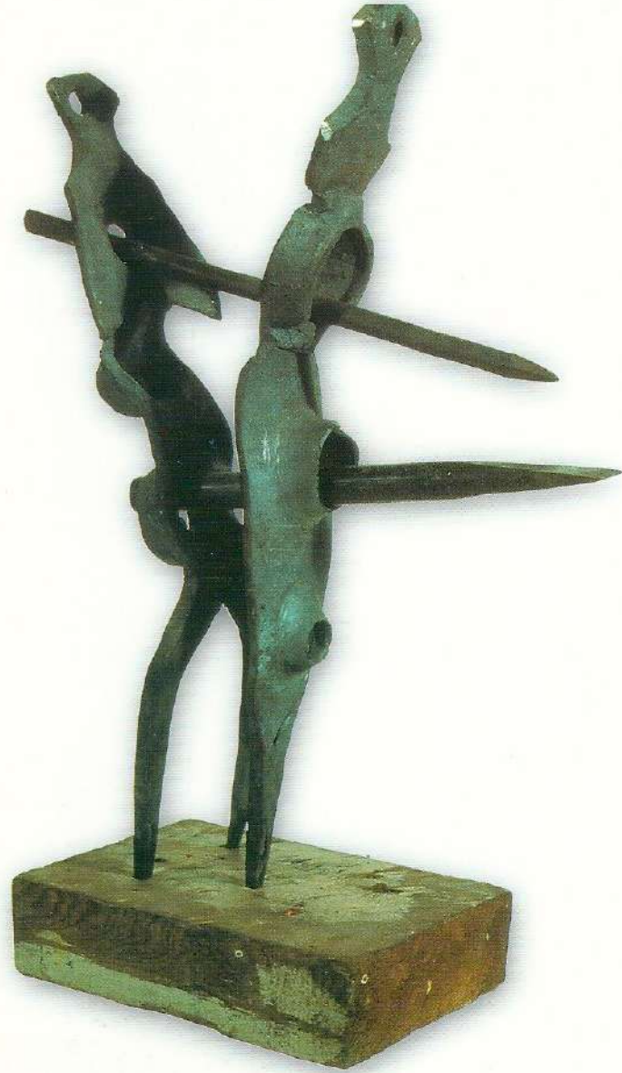
"Idol Serisi III" - 1997, Çelik, 37x30x10 cm.