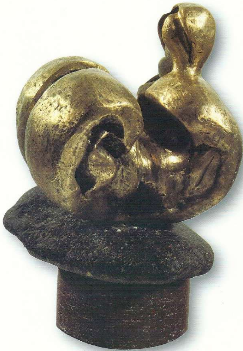
"Katlanaan" - 1996, Bronz, 35x19x15 cm.