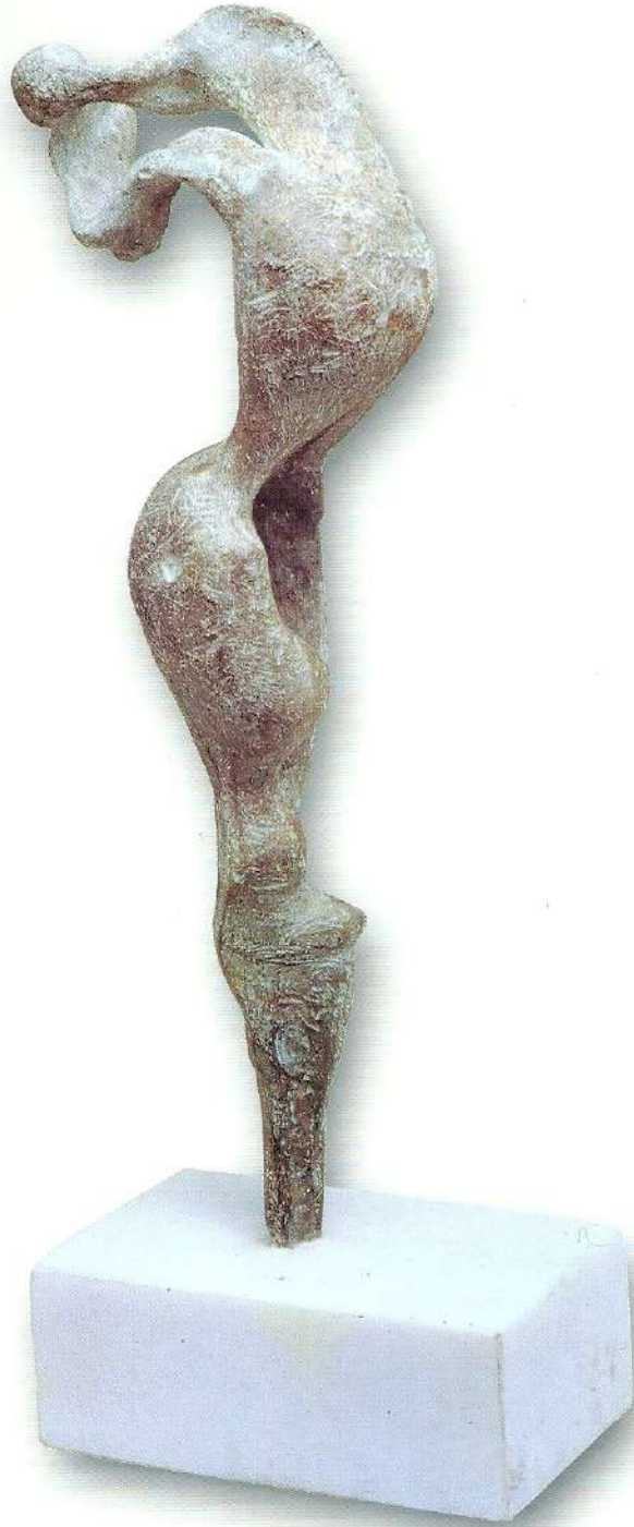
"Çağırış" - 1992, Bronz, 62x15x30 cm.