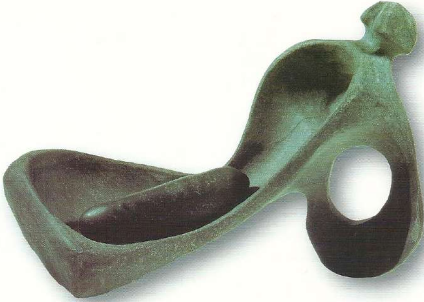
"Ana Kucağı" - 1997, Taş, 20x28x15 cm.