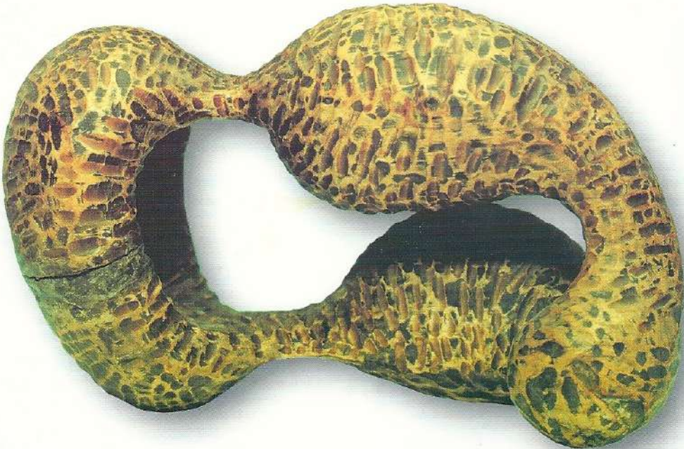
"Bağlılık" - 1987, Ceviz Ağacı, 25x40x19 cm.