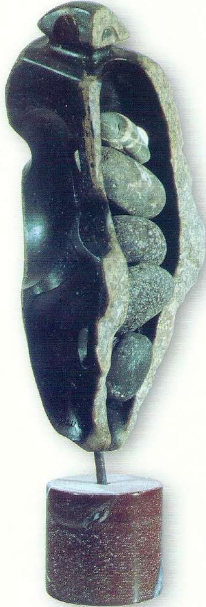
"Taşların Yaşamı" - 1996, Taş, 70x27x25 cm.