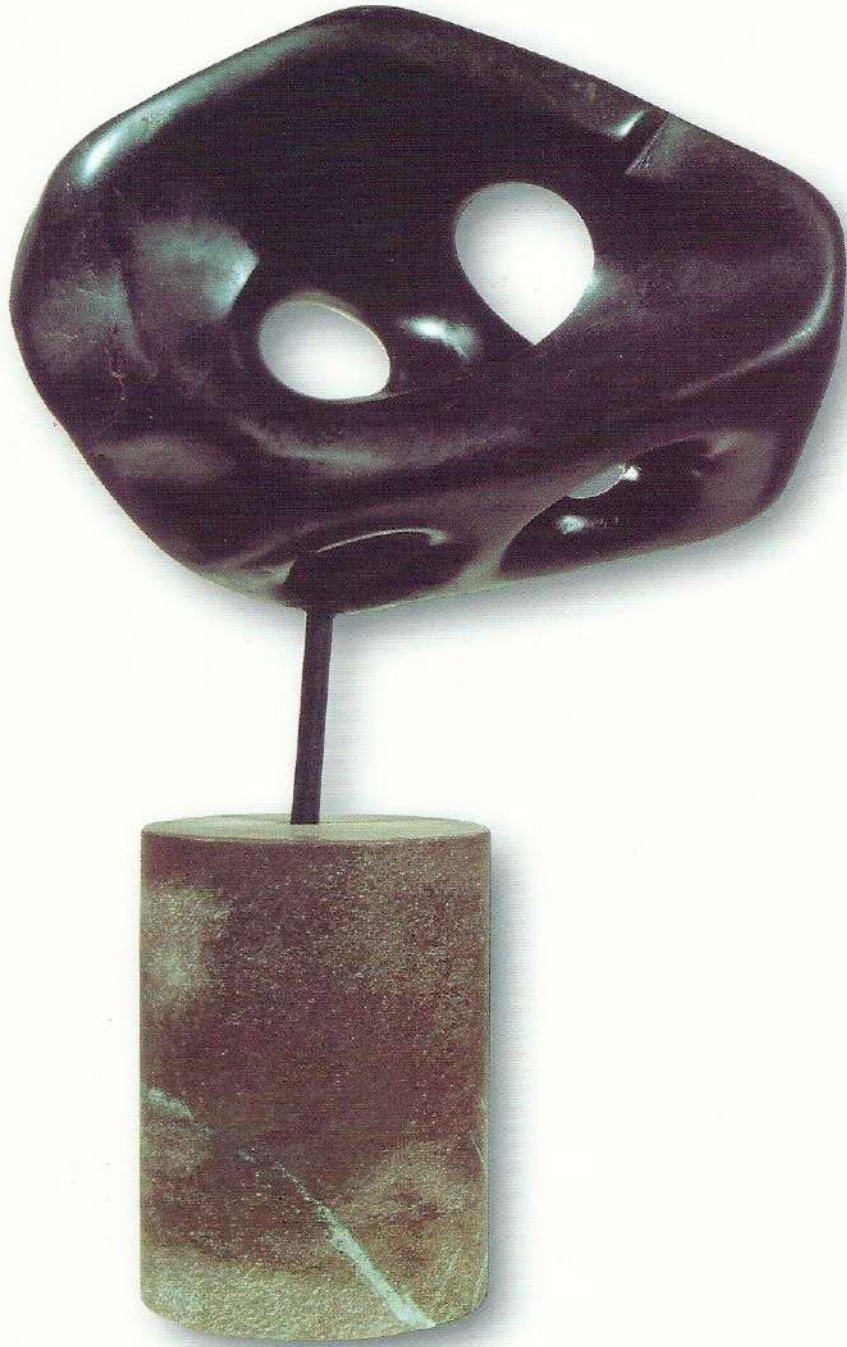
"Güneş Penceresi" - 1996, Taş, 37x29x7 cm.