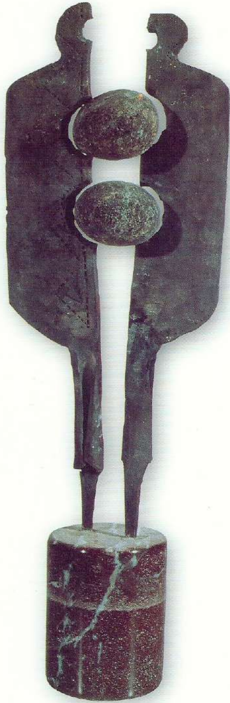
"Idol Serisi V" - 1997, Çelik, 57x18x10 cm.