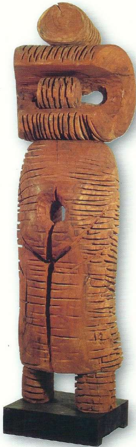
"Nibada (Tanrıça)" - 1997, Dui Ağacı, 145x43x30 cm.