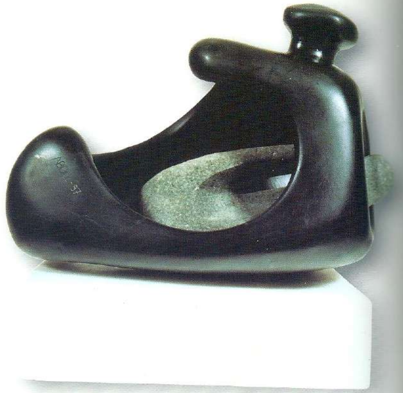
"İçteki Figür" - 1997, Taş, 26x24x17 cm.