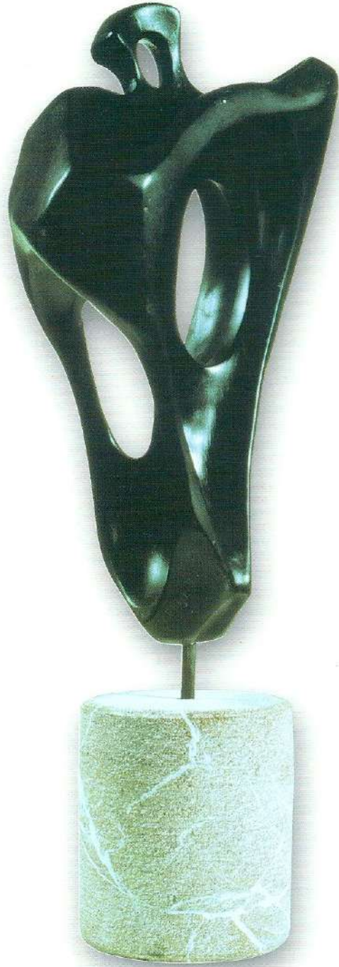
"Taştaki Değişim" - 1997, Taş, 52x25x13 cm.