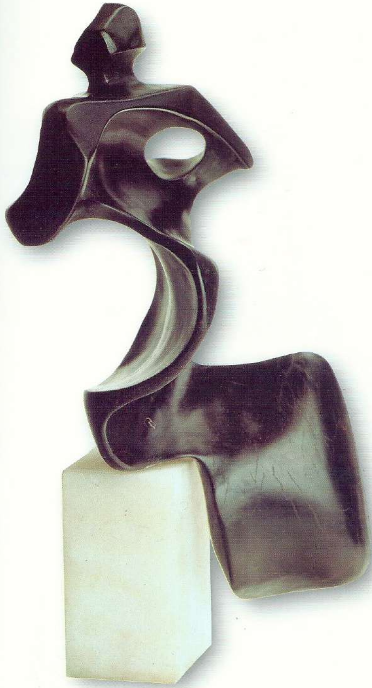
"Oturan Kraliçe" - 1997, Taş, 40x20x13 cm.