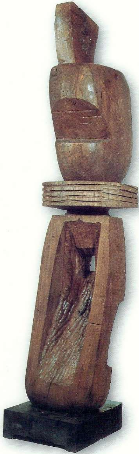
"II. Lugal (Büyük Adam)" - 1997, Ceviz Ağacı, 145x33x35 cm.