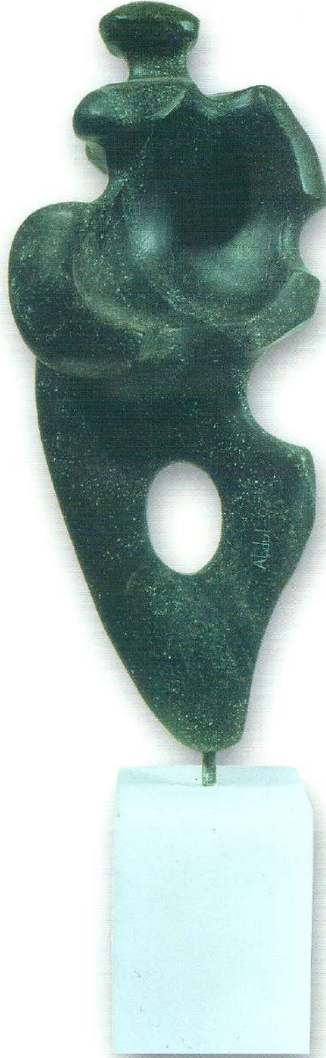
"Güzel Görünmek" - 1997, Taş, 44x12x8 cm.