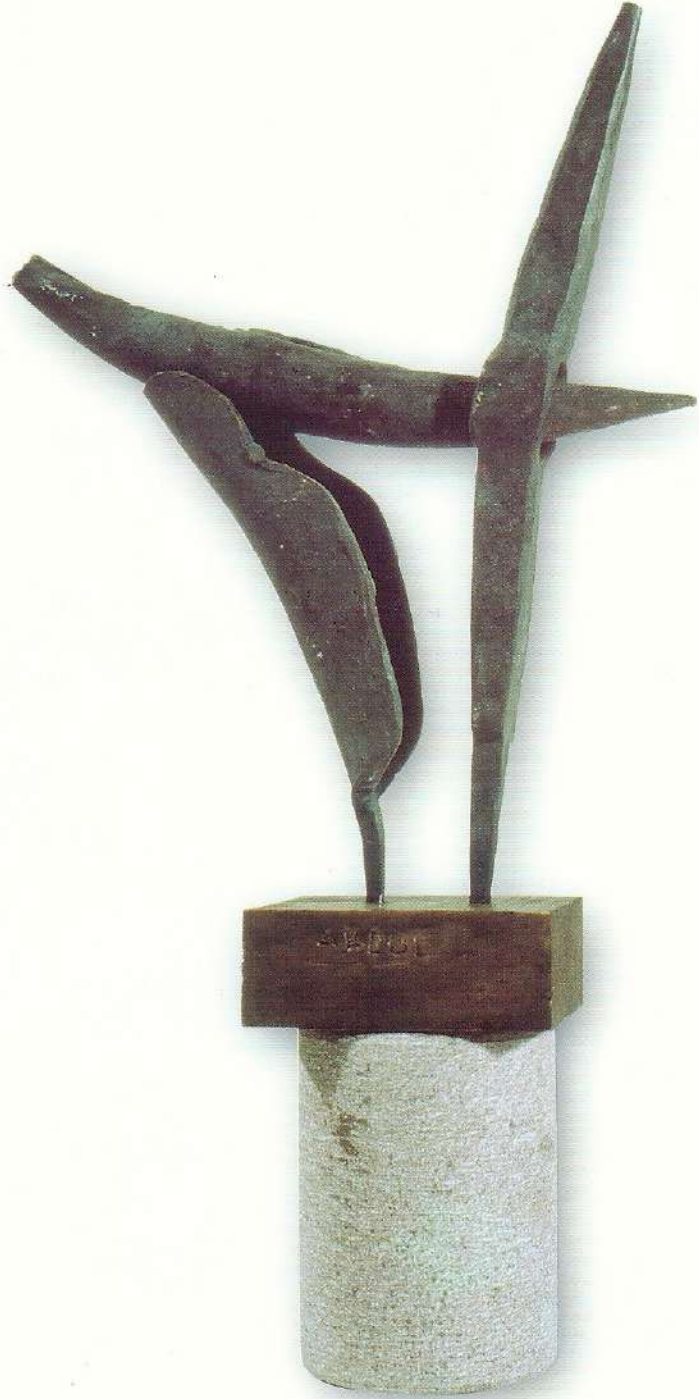
"Idol Serisi IV" - 1997, Çelik, 52x30x8 cm.