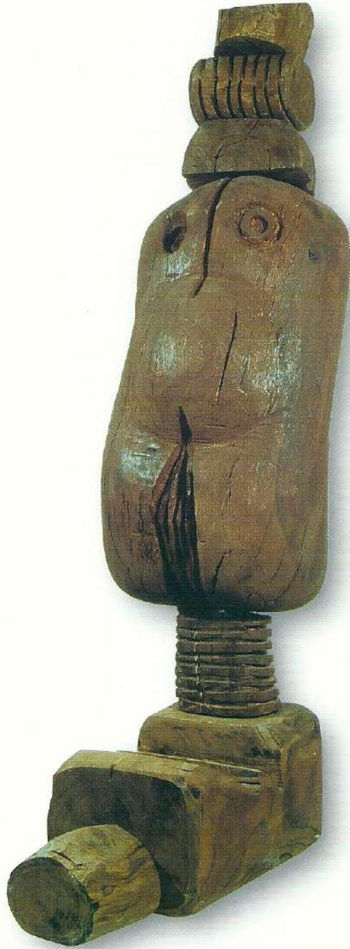
"I. Lugal (Büyük Adam)" - 1997, Meşe Ağacı, 135x41x62 cm.