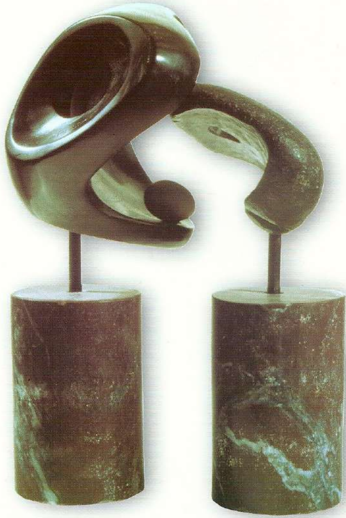
"İkili Hareket" - 1997, Taş, a) 30x25x23 cm. b) 25x17x7 cm.