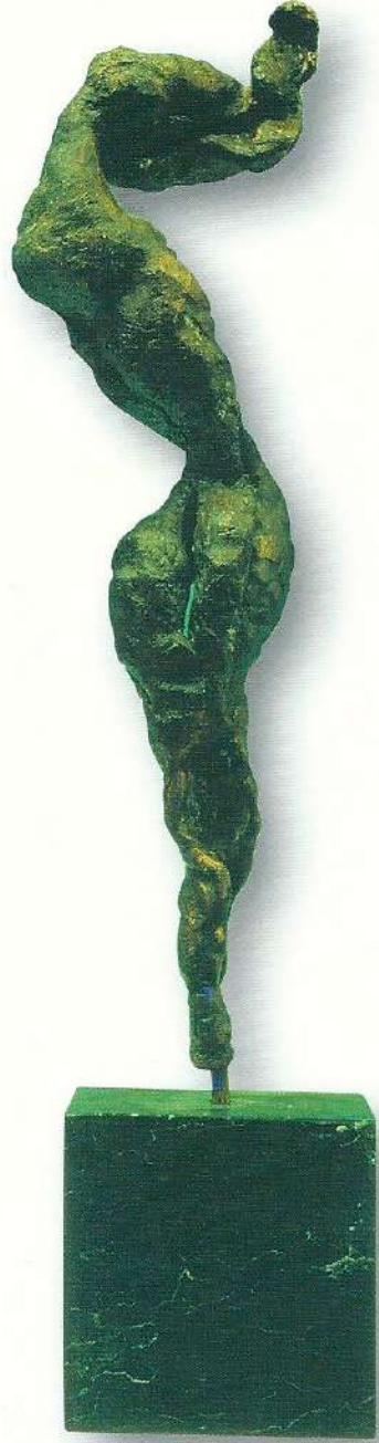
"Zaman İinde Fięur" - 1993, Bronz, 70x17x10 cm.