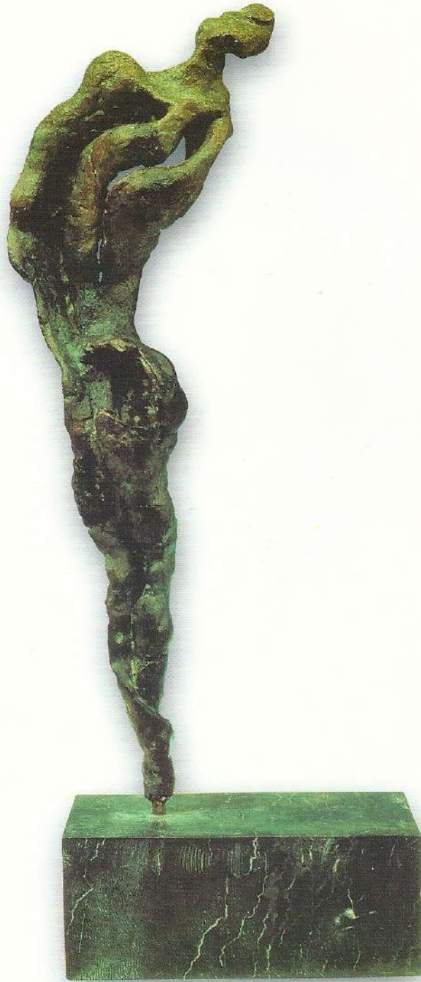
"Zamandan Öte Figür" - 1993, Bronz, 71x11x8 cm.