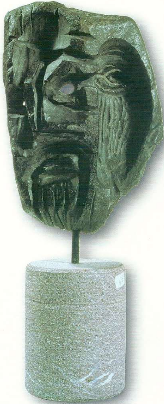
"Portre 1" - 1997, Taş, 39x17x10 cm.