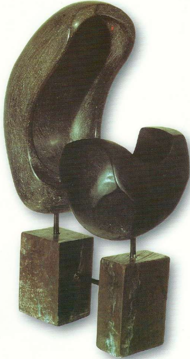
"Taşların Çılgığı" - 1997. Taş. a) 28x18x12 cm. b) 46x13x17 cm.