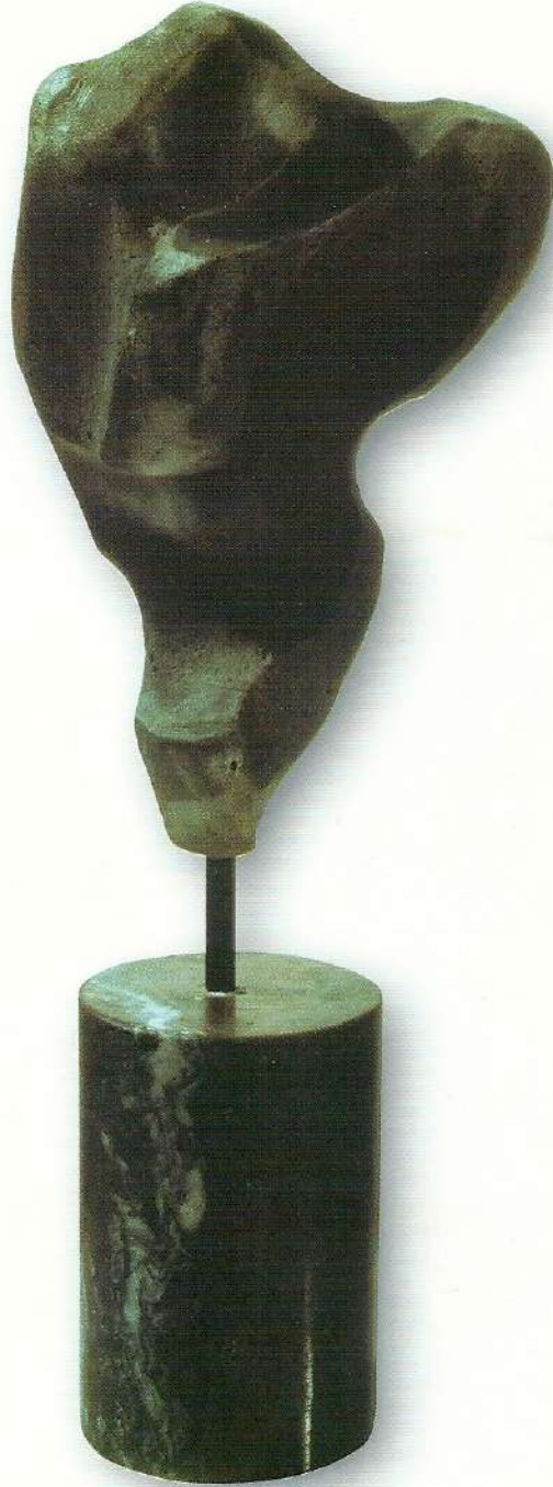
"Sevginin Gücü" - 1996, Taş, 39x16x10 cm.