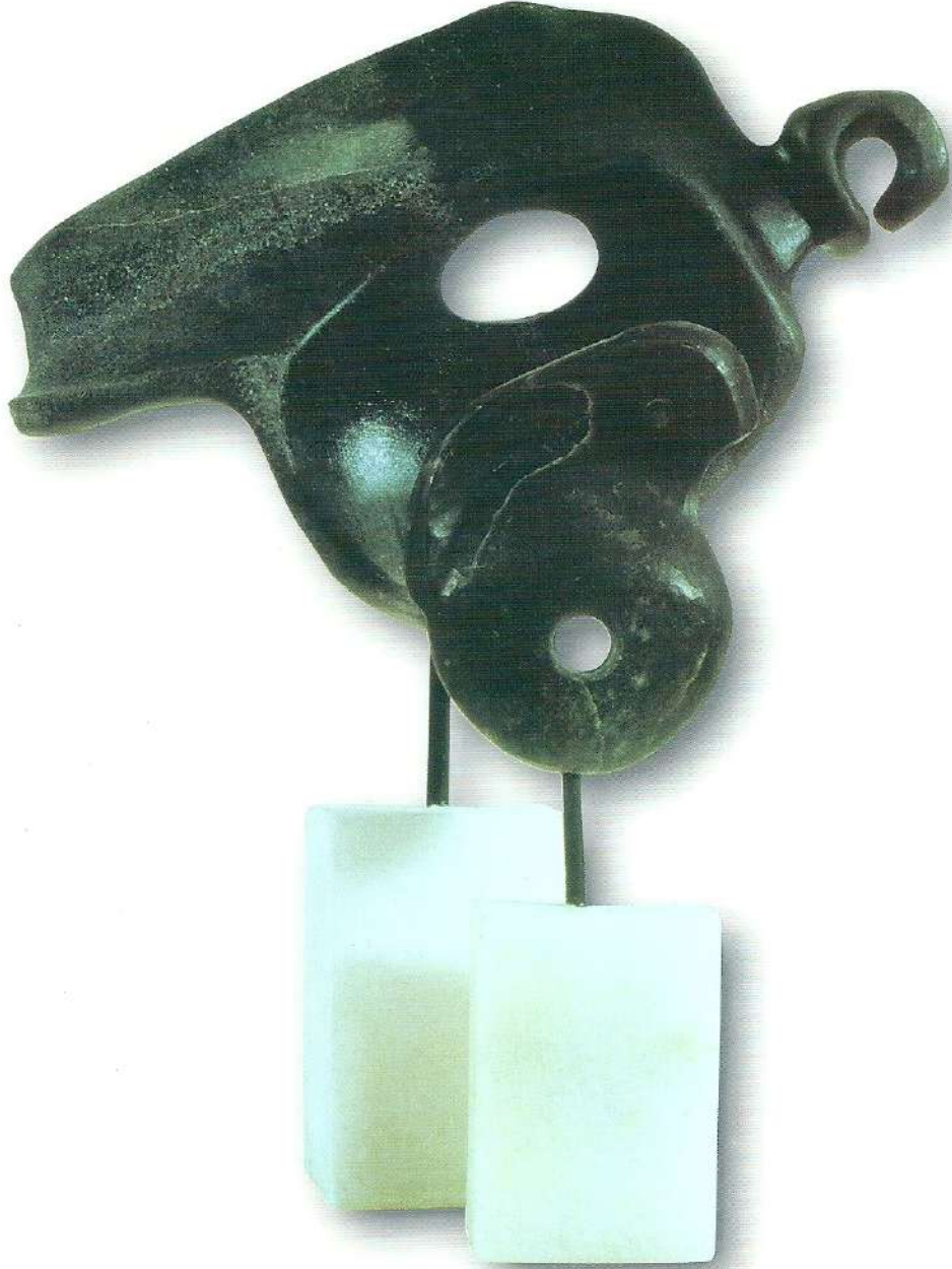
"Kuşlar" - 1997, Taş, a) 40x33x9 cm. b) 28x11x5 cm.