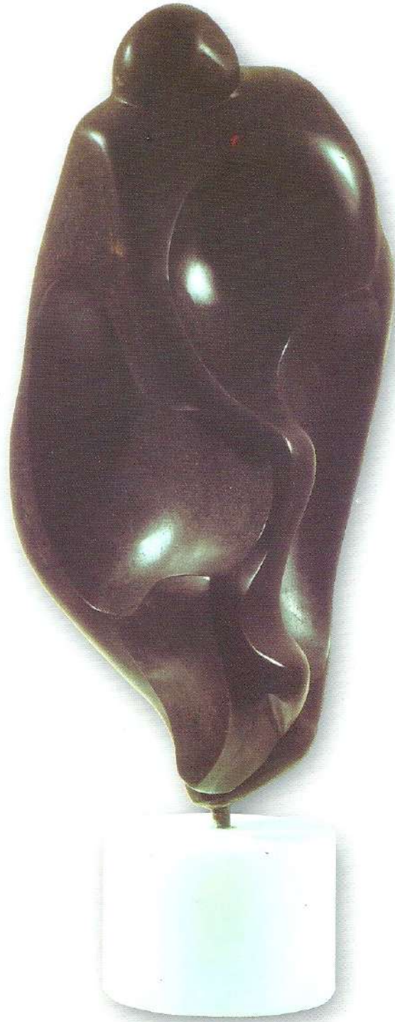
"Geleceği Aramak" - 1996, Taş, 65x28x23 cm.