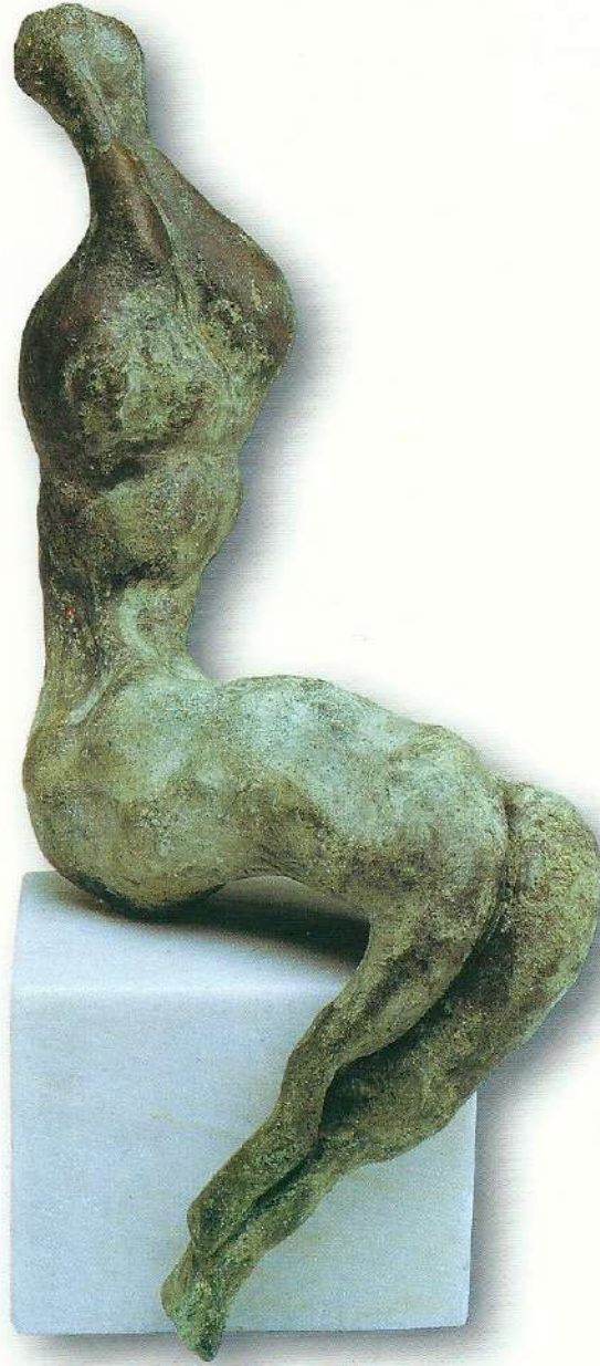
"Oturan Figür" - 1992. Bronz - Y, 22,5 cm.