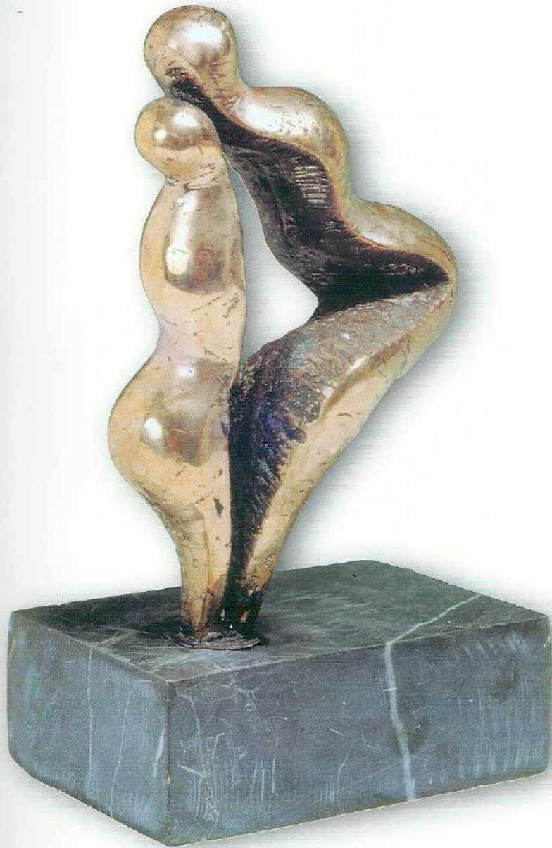
"Sevgi" - 1993, Bronz, 23x6x4 cm.