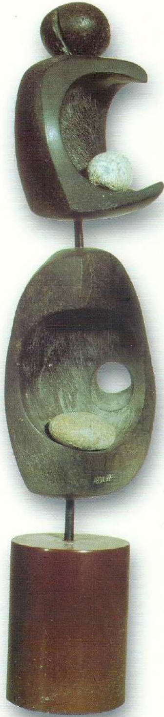
"İkili İdoller" - 1997, Taş, 14x12 cm.