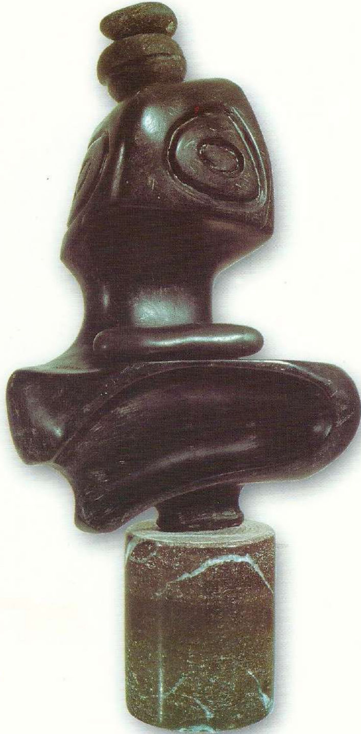
"Özlem" - 1997, Taş, 47x25x13 cm.