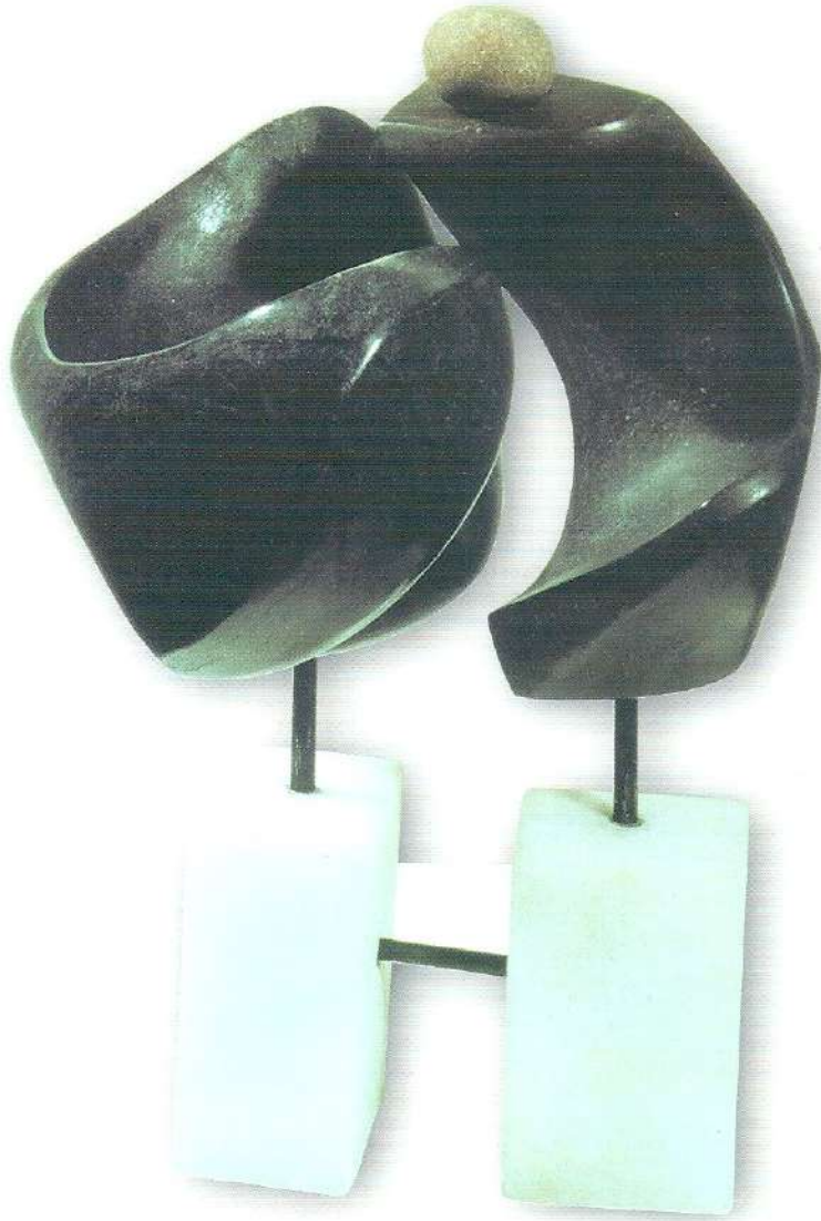
"Taşlardaki Sevgi" - 1997, Taş, a) 34x29x20 cm. b) 39x10x10 cm.