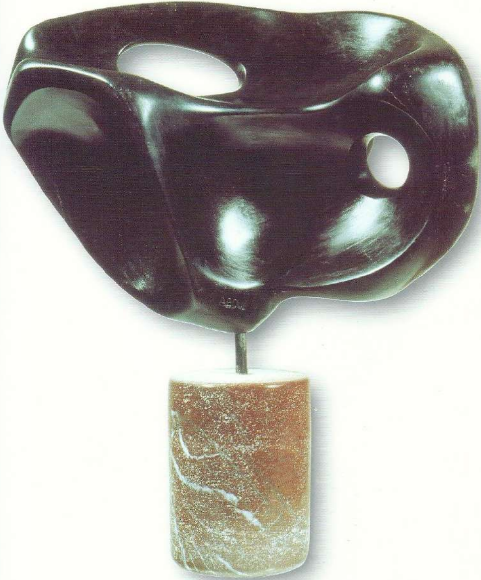
"Taşın Sessizliği" - 1997, Taş, 41x33x20 cm.