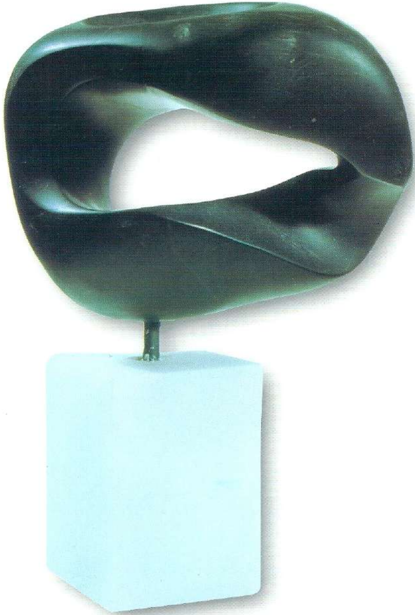
"Bükülen Sevgi" - 1996, Taş, 30x26x10 cm.