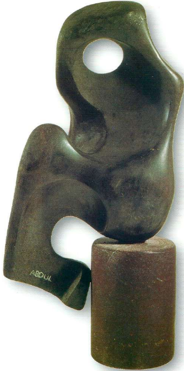
"Güneş Penceresi" - 1996, Taş, 37x24x9 cm.