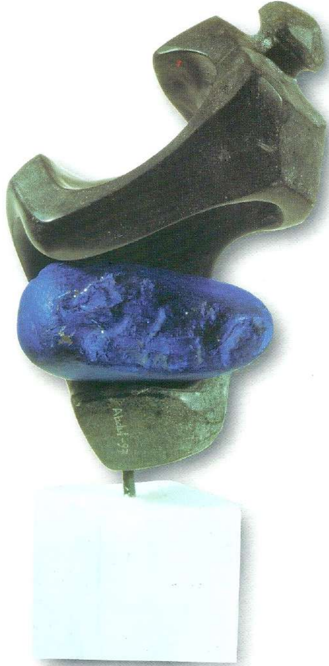
"Büklülen Sevgi" - 1996, Taş, 48x14x20 cm.