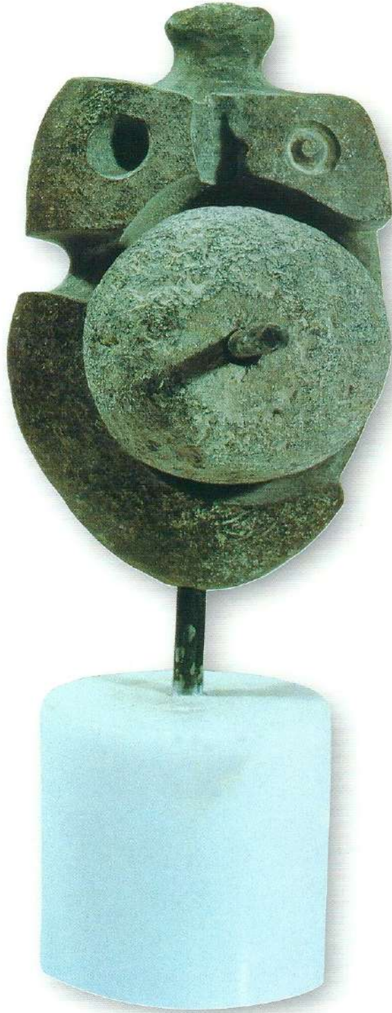
"Taşınan Dünya" - 1997, Taş, 29x16x10 cm.