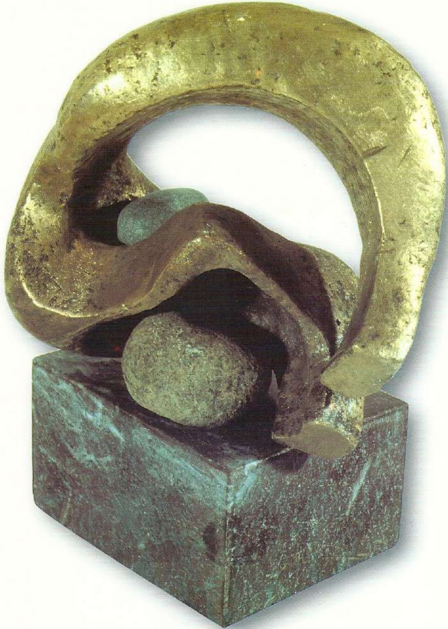
"Böyle mi Olacaktık" - 1996, Bronz, 27x20x10 cm.