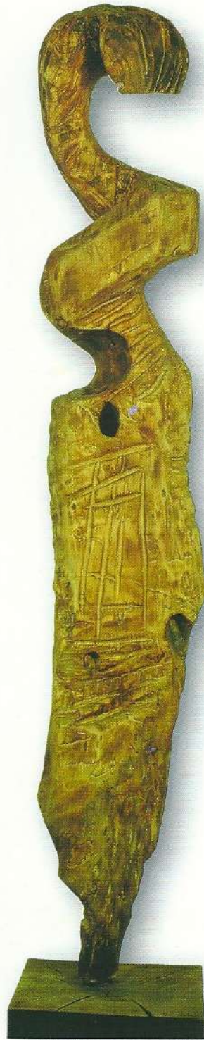
"Sonsuza Uzanmak" - 1993, Ahşap, 158x21x26 cm.