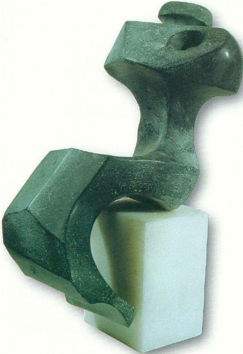
"Düşünen Figür" - 1996, Taş, 36x20x15 cm.