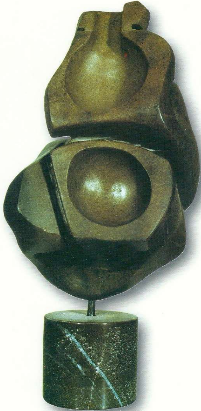
"Taşların Yaşamı" - 1996, Taş, 70x27x25 cm.