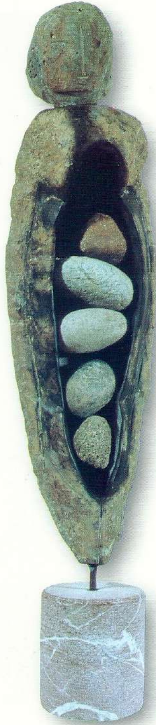
"Genç Kızın Rüyası" - 1996, Taş, 88x20x10 cm.