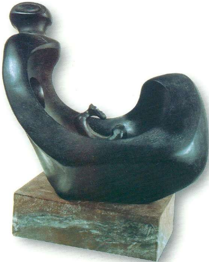
"Anne ve Çocuk" - 1997, Taş, 33x23x12 cm.