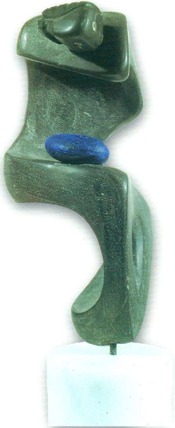
"İçteki Eğilimi" - 1997, Taş, 51x15x20 cm.