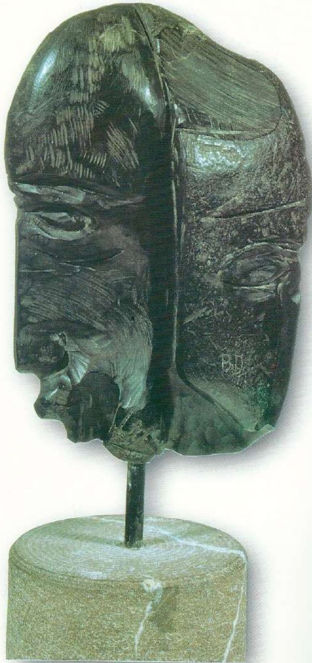
"Portre III" - 1997, Taş, 39x17x10 cm.