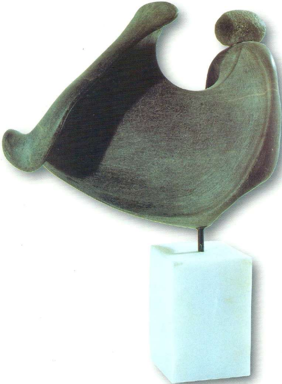
"Sevda Bulutu" - 1996, Taş, 48x32x15 cm.