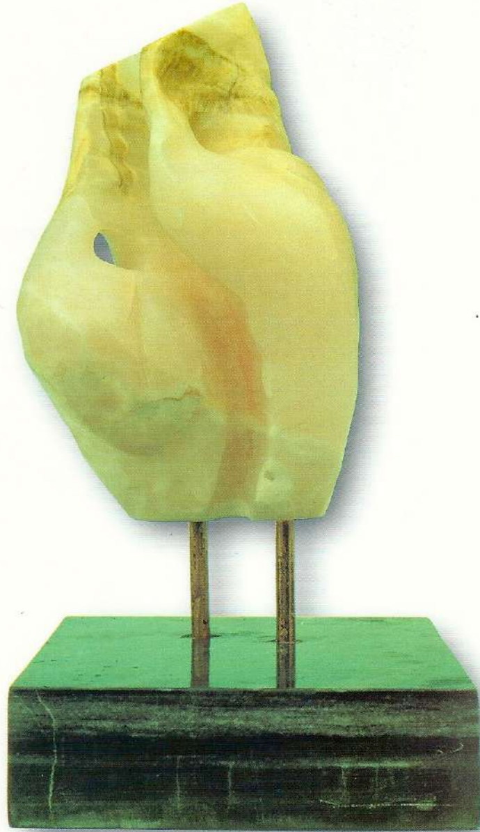
"Bağlılar" - 1991, Onisk Mermer, 38x20x20 cm.