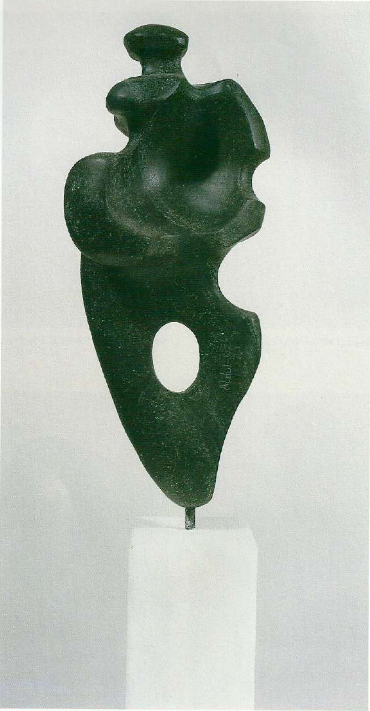
"Güzel Görünmek", 1997, 44 x 12 x 8 cm, taş