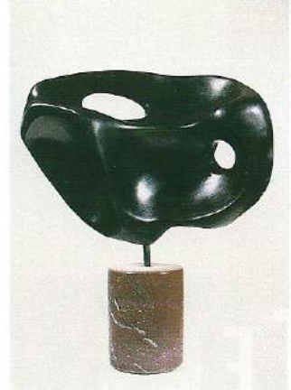
"Taşın Sessizliği" 1997, 41 x 33 x 20 cm, taş