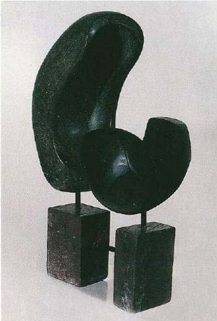
"Taşların Çılgılığı", 1997, a) 28 x 18 x 12 cm, taş b) 46 x 13 x 17 cm, taş