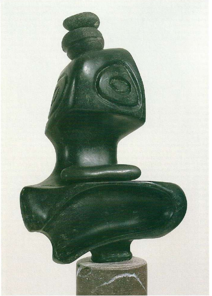
"Özlem", 1997, 47 x 25 x 13 cm, taş

ÖN KAPAK: "Nidaba (Tanrıça)", 1997, 145 x 43 x 29 cm, dut ağacı ARKA KAPAK: "Genç Kızın Rüyası ", 1996, 88 x 20 x 10 cm, taş