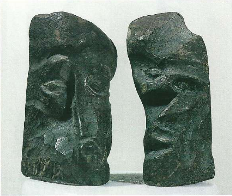
"2'li Portre", 1997, 30 x 13 x 8 cm, taş