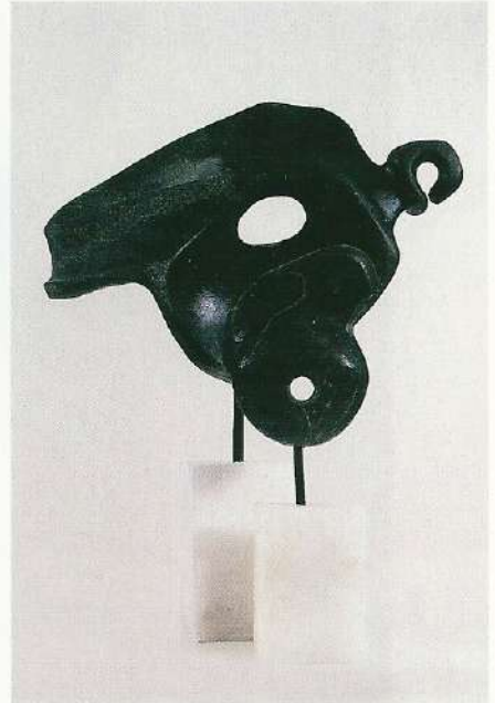
"Kuşlar", 1997, a) 40 x 33 x 9 cm, taş b) 28 x 11 x 5 cm, taş