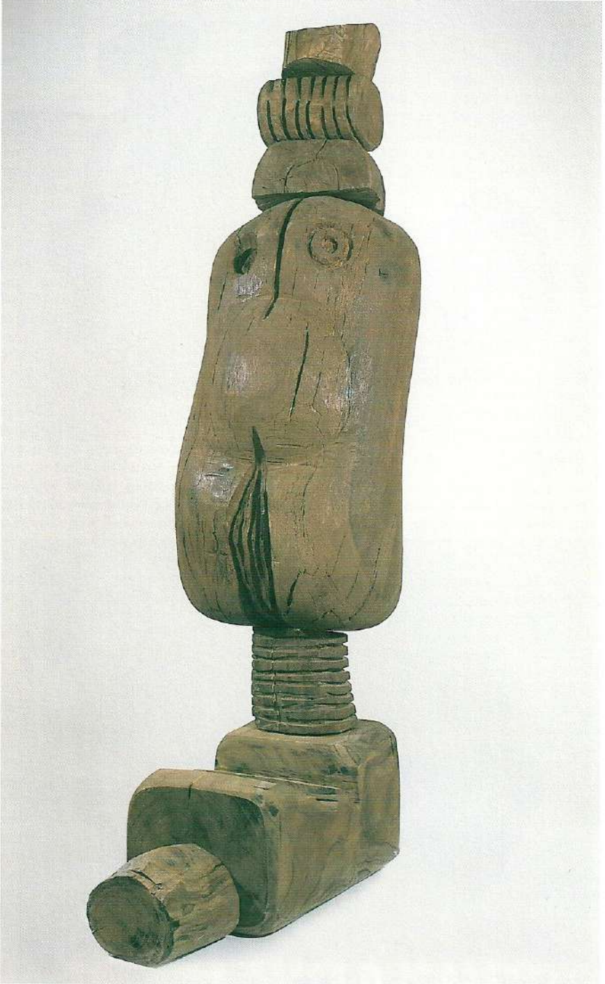
"1. Lugal (Büyük Adam)", 1997, 135 x 41 x 62 cm, meşe ağacı