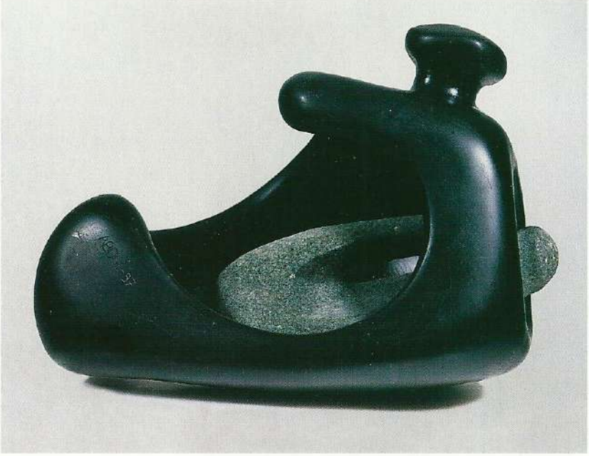
"İçteki Figür", 1997, 26 x 24 x 17 cm, taş