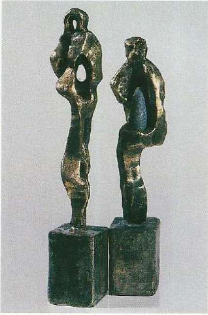
"Kat Kat Uzmanmak", 1997, 29 x 5 x 5 cm, bronz