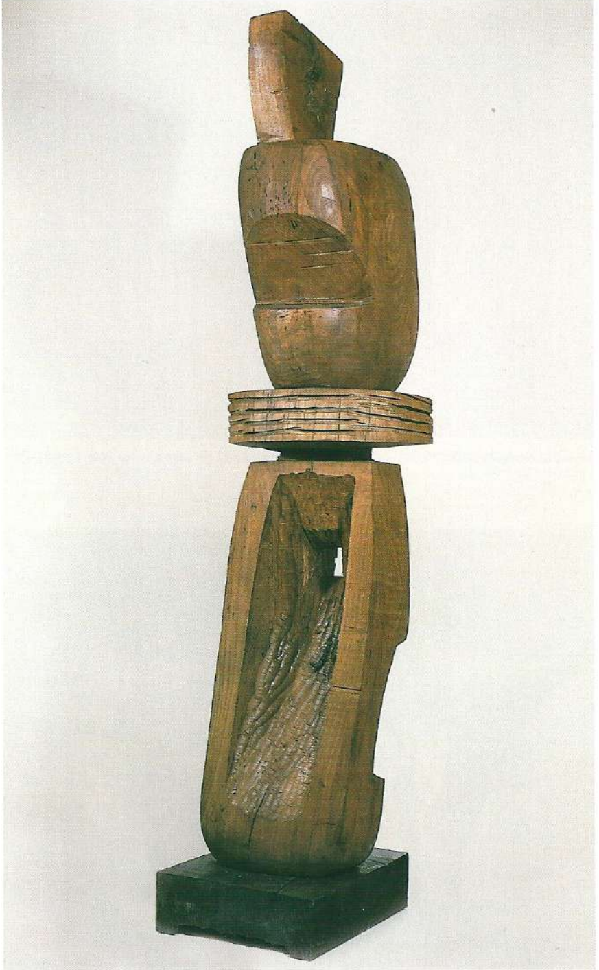
"2. Lugal (Büyük Adam)", 1997, 145 x 33 x 35 cm, ceviz ağacı