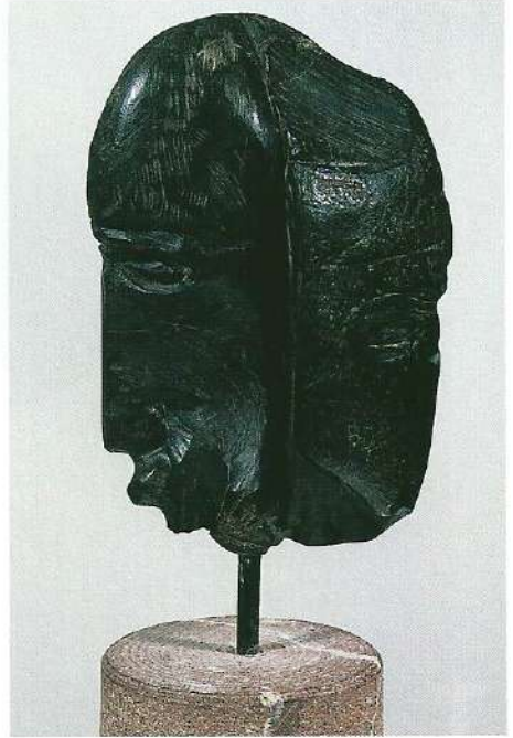
"Portre III", 1997, 36 x 14 x 8 cm, taş