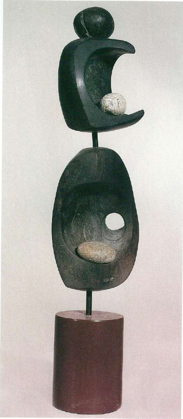
"İkili İdoller", 1997, 57 x 14 x 12 cm, taş