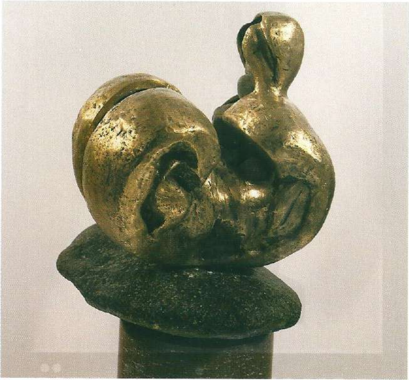
"Katlanan", 1997, 35 x 19 x 15 cm, bronz