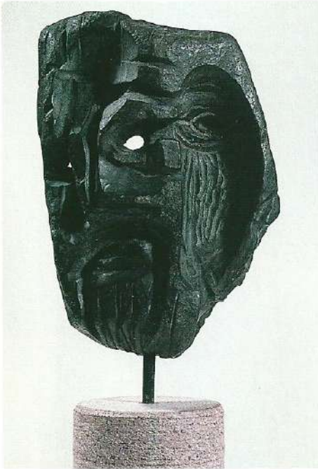
"Portre I", 1997, 39 x 17 x 10 cm, taş