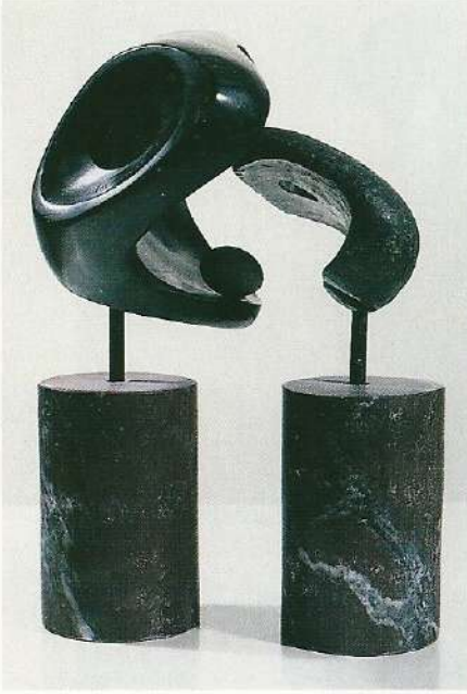
"İkili Hareket", 1997, a) 30 x 25 x 13 cm, taş b) 25 x 17 x 7 cm, taş