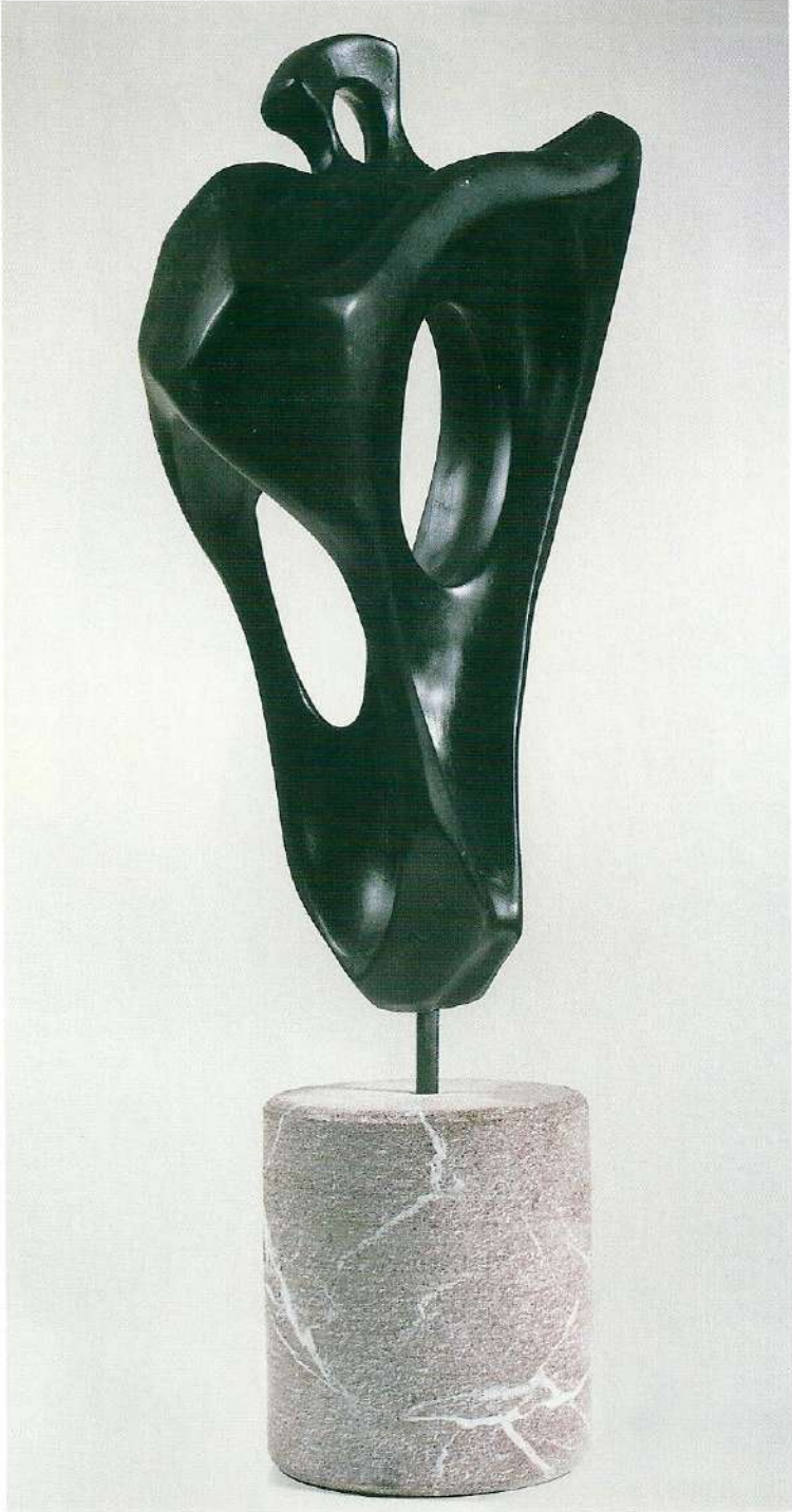
"Taştaki Değişim", 1997, 52 x 25 x 13 cm, taş