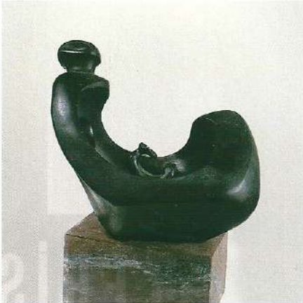
"Anne ve Çocuk", 1997, 33 x 23 x 12 cm, taş

Konusunu insandan alan Abdulkadir Öztürk'ün çok çeşitli malzeme ile yaptığı heykeller yaşadığı çağın bir anlatımı gibidir. Eserlerinde insanın yaşam mücadelesini, sevgiyi, erotikmi iç içe, sıcak fakat sorgulayan bir dille işleyen sanatçı, soyutlayıcı gizemler kattığı insan figürünü yüceltir.