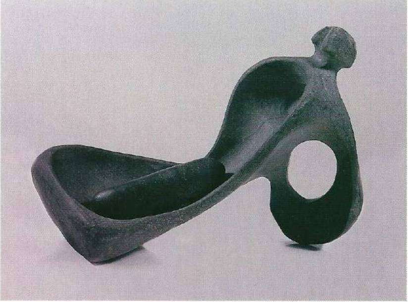
"Ana Kucağı", 1997, 20 x 28 x 15 cm, taş