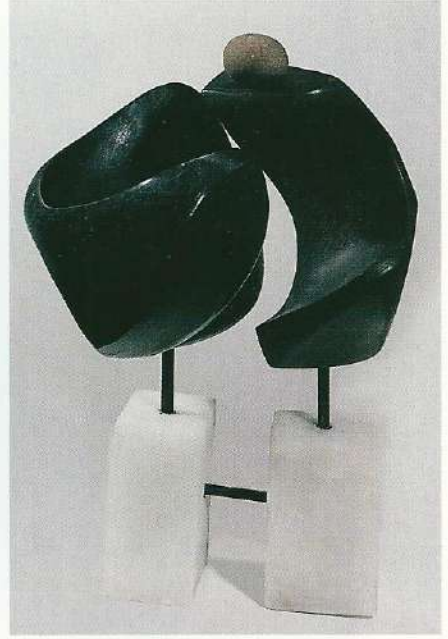
"Taşlardaki Sevgi", 1997, a) 34 x 29 x 20 cm, taş b) 39 x 10 x 10 cm, taş