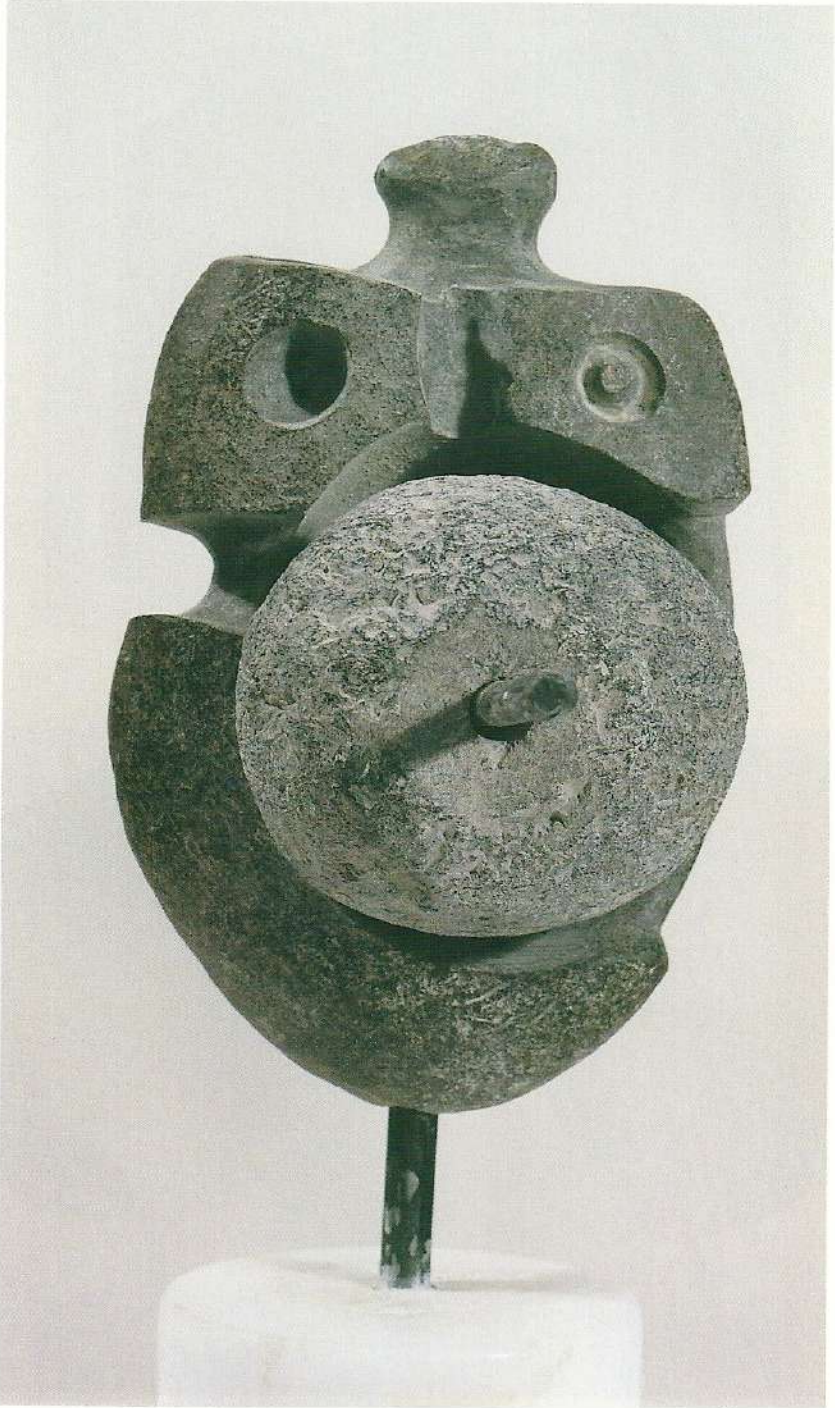
"Taşınan Dünya", 1997, 29 x 16 x 10 cm, taş