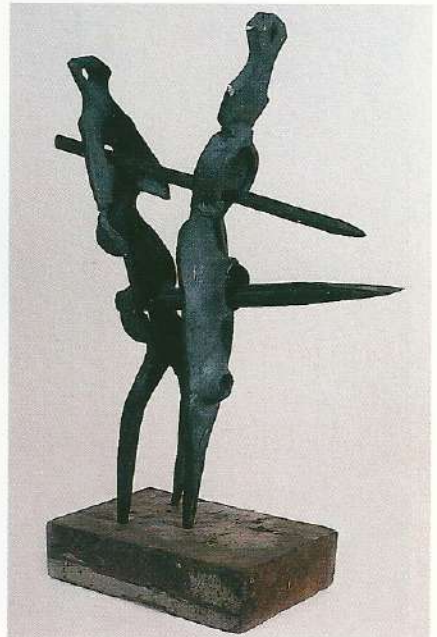
"İdol Serisi III", 1997, 37 x 30 x 10 cm, çelik