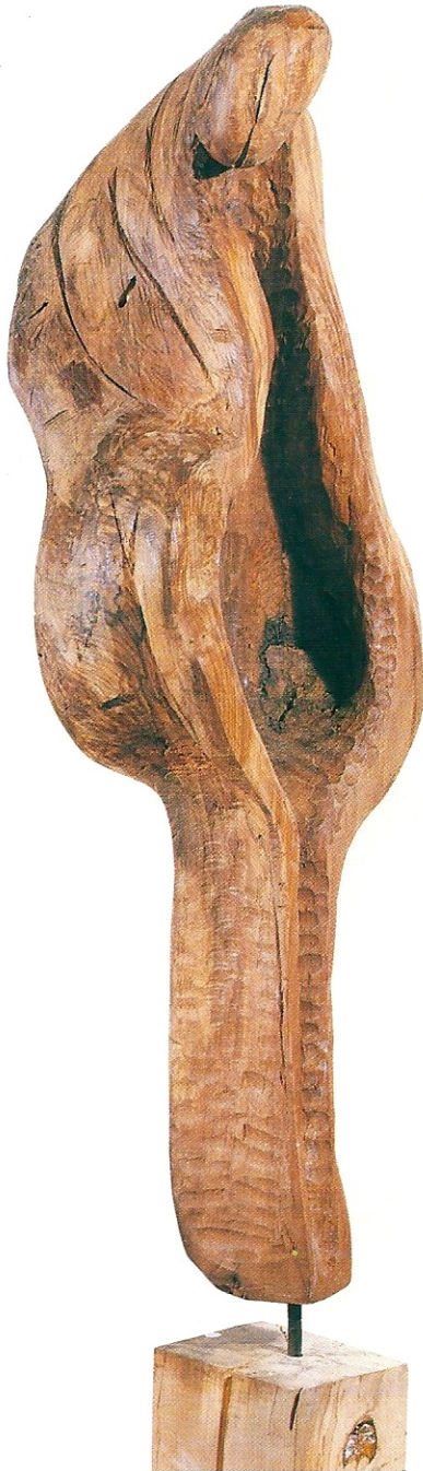
"Yaşam Şekli", 1995, 95 x 30 x 18.5 cm, karaağaç