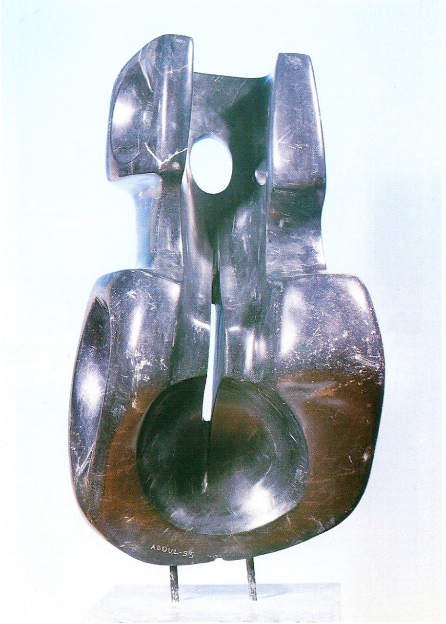
"İdolleşmek", 1995, 42 x 26 x 15 cm, serpantin taşı

Ön Kapak : "Üç Başlı Figür", 1994, 105 x 33 x 32 cm, bronz döküm tek parça