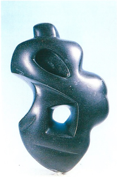
"Figürün Gölgesi", 1995, 20 x 12 x 6 cm, serpantin taşı