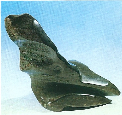
"Uzlamak", 1995, 33 x 50 x 20 cm, serpantin taşı

rak çağdaş bir dille yorumlar. Çevresindeki doğal zenginliklerden esinlenerek soyut figüratif eserler veren sanatçı, insan figürünün tors estetiğini gizemler, insanların yaşadığı çevreyle sorumluluklarını sorgulayarak, bütünleşmesini sağlamaya çalışır. Abdülkadir Öztürk, doğal şartlarda oluşmuş bir taşın formunu kendi estetik form anlayışıyla birlikte yorumlayarak eserini yaratmaktadır. Taşı, milyonlarca yıl önceki oluşumunun içine girip, kristalleşme özelliğine tanık olmuşçasına, günümüze taşır; böylelikle, taşın ve ağacın, sanatçının elinde, yeniden şekillendirme süreci sonunda yeni kimliğini kazanmış izleriz.