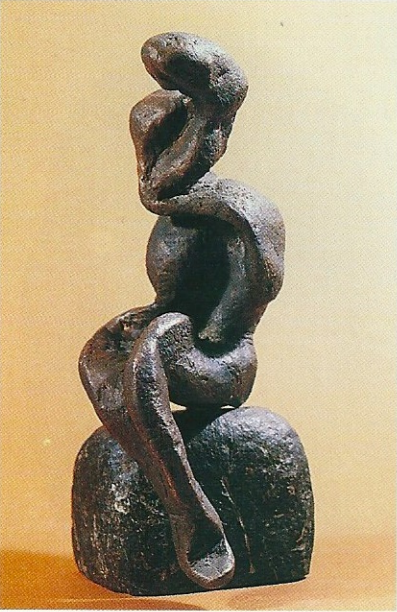
"Taş Üstünde Oturmak", 1995, 25 x 13 x 10 cm, bronz döküm tek parça