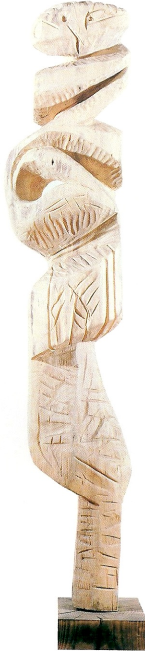
"Görülmeyen Bakış", 1994, 160 x 34 x 17 cm, ıhlamur ağacı