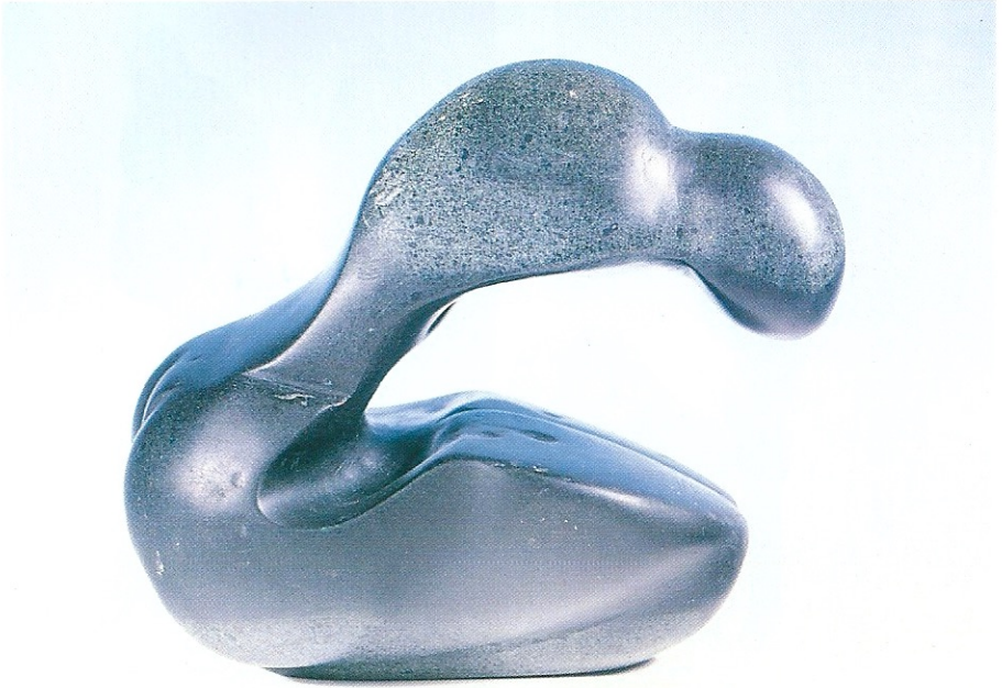
"Diz Üstü Oturan Figür", 1995, 13 x 14 x 9 cm, serpantin taşı