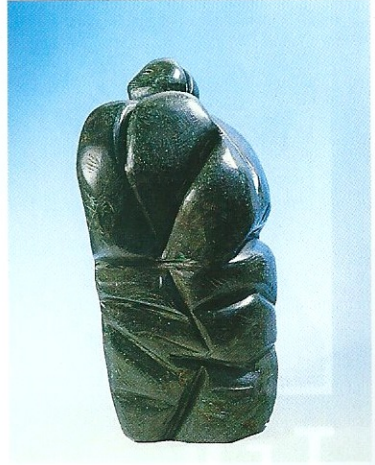
"Sirt Sirta Yaşamak", 1995, 31 x 13 x 13 cm, serpantin taşı