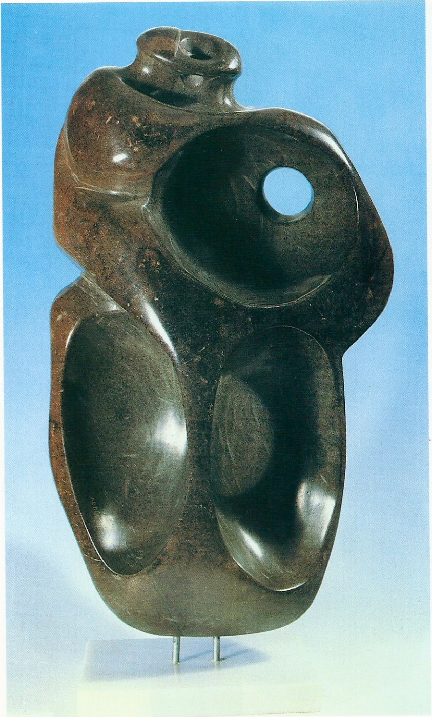
"Sevgi Güneşi", 1995, 47 x 27 x 16 cm, serpantin taşı