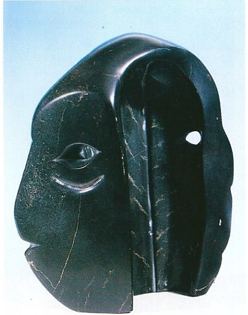
"Bakış", 1995, 20.5 x 20 x 9 cm, serpantin taşı