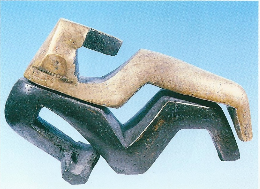
"Birliktelik", 1993, 25 x 40 x 9 cm, bronz döküm 1/4