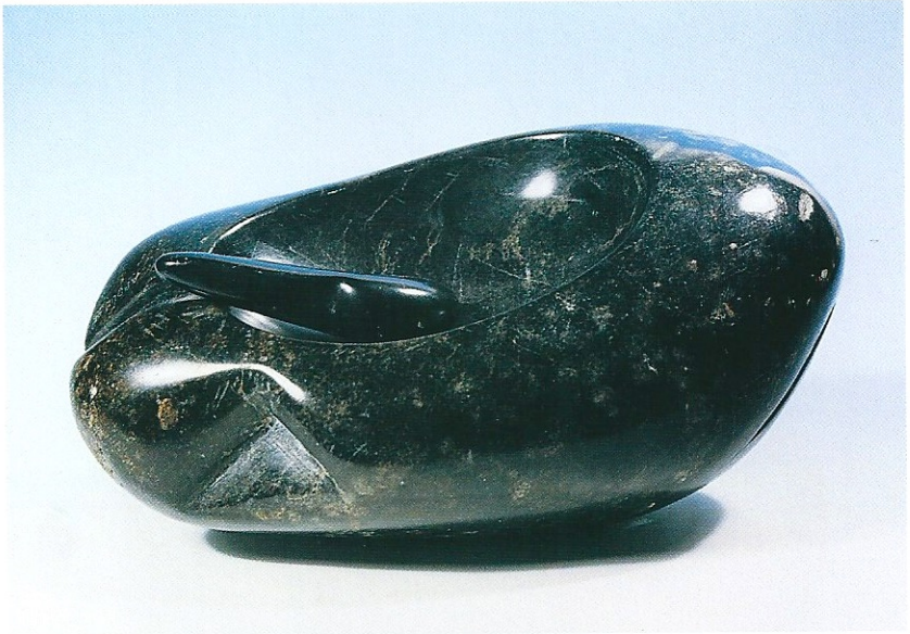
"Uyuyan Gzel", 1995, a- 12 x 23 x 13 cm, b- 3 x 8 x 2 cm, serpantin taşı