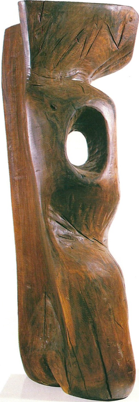
"Farklı Yaşama Doğru Gidiş", 1995, 102 x 38 x 34 cm, ceviz ağacı