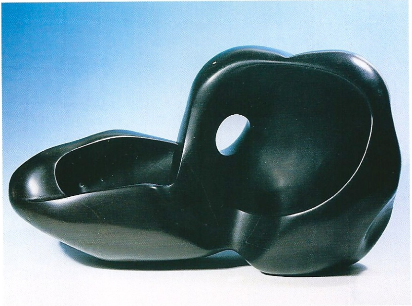
"Uzanım", 1995, 21 x 36 x 18 cm, serpantin taşı