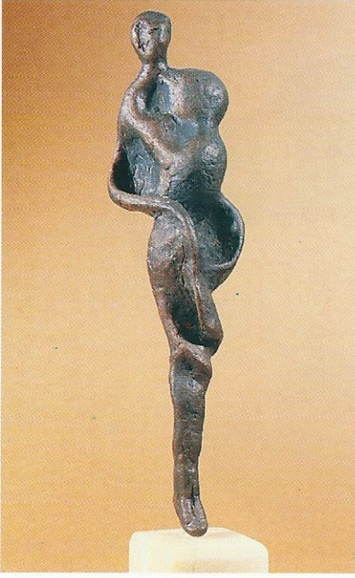
"Balerin", 1994, 26 x 7 x 5 cm, bronz döküm tek parça