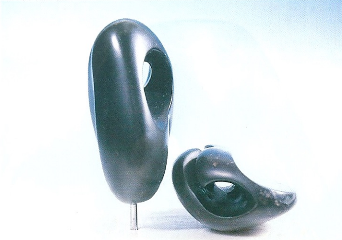
"İkili Görünüm", 1995, a- 10 x 8 x 5 cm, b- 4 x 10 x 7 cm, serpantin taşı