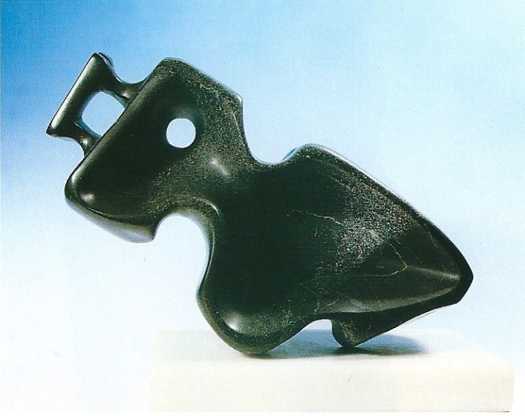
"Güne Bakmak", 1995, 19 x 11 x 30 cm, serpantin taşı