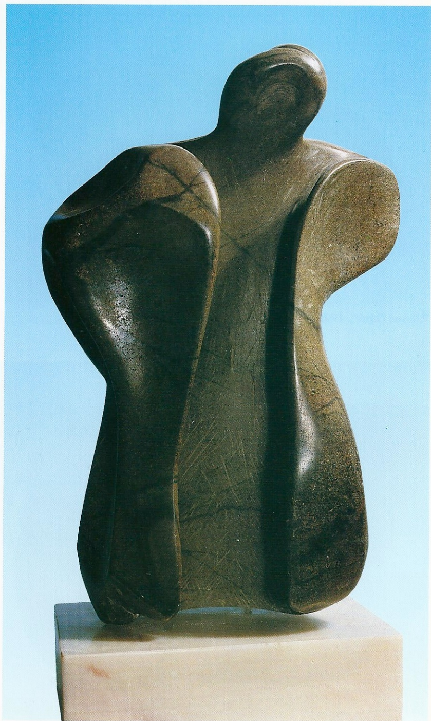
"İç Oyumlar", 1995, 37 x 18 x 18 cm, serpantin taşı