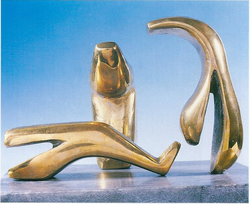
"Üçlü Kompozisyon", 1993, 18 x 26 x 19 cm, bronz döküm tek parça