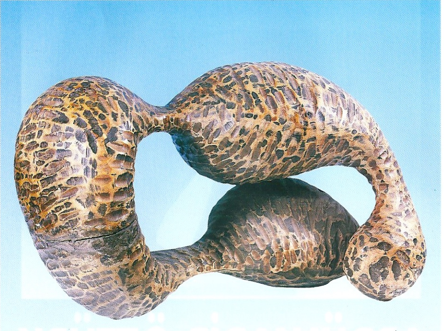
"Bağlılık", 1989, 25 x 40 x 19 cm, ceviz ağacı

Açılış 11 Mart 1996 Pazartesi Saat 18.00