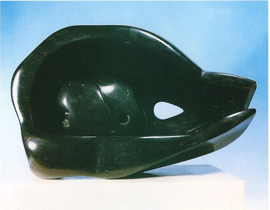
"Aile Kucağı", 1995, a- 35 x 25 x 11 cm, b- 10 x 14 x 5 cm, serpantin taşı